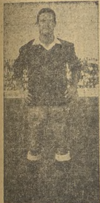
Puche fichó por el Manchego y debutó ya en Cieza

ALBACETE. (De nuestro corresponsal, RUESCAS). El Albacete venció por 1-0 al Manchego de Ciudad Real, en su partido de presentación. MANCHEGO: Migueliche; Amores, Valch, Pou; Quesada, Chico; Osuna (Dioni), Morilla, (Julito), Salvi, José Carlos y Tasi.