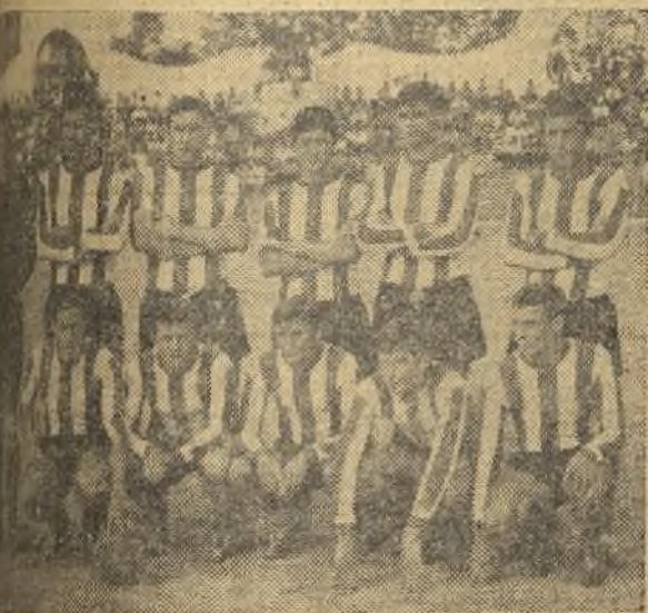
El Cacereño, que el domingo se enfrentó al Betis.

(Crónica de nuestro responsable JOSE MARIA) res rendirán plenamente, estarán en completa franquía. ASI VIMOS A LOS EQUIPOS El Betis presentó un segundo