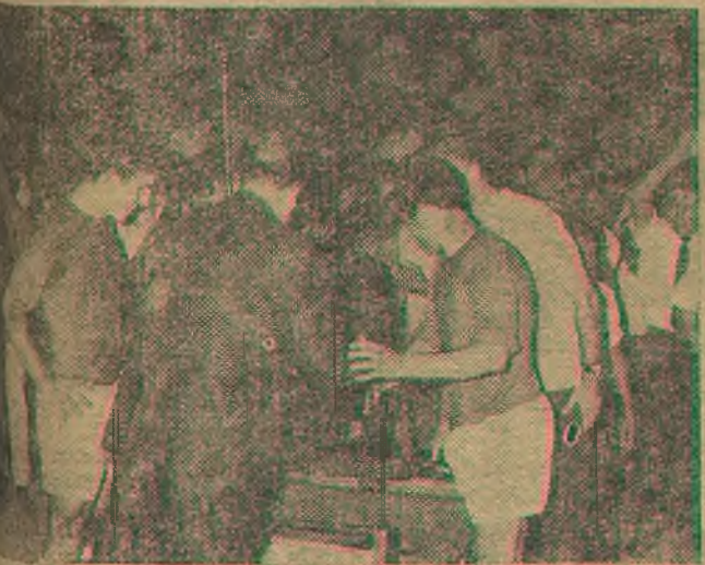
Calleja hace entrega del Trofeo Cervantes al capitán de la Alcalá, primer ganador del mismo, al vencer al Coruña en la final. (Información en la página tercera)