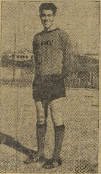
Larrondo ha ido al Carabanchel

tilla anterior del Fercu, casi todos sus jugadores, militarán esta temporada defendiendo equipos de la difícil Tercera División.