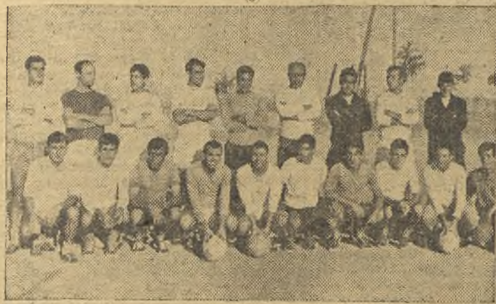
Plantilla del Mérida Industrial para la temporada 67-68

de que muchos equipos no atraían público al campo. En cambio ahora, en esta temporada todos los partidos serán como una final, y en años siguientes