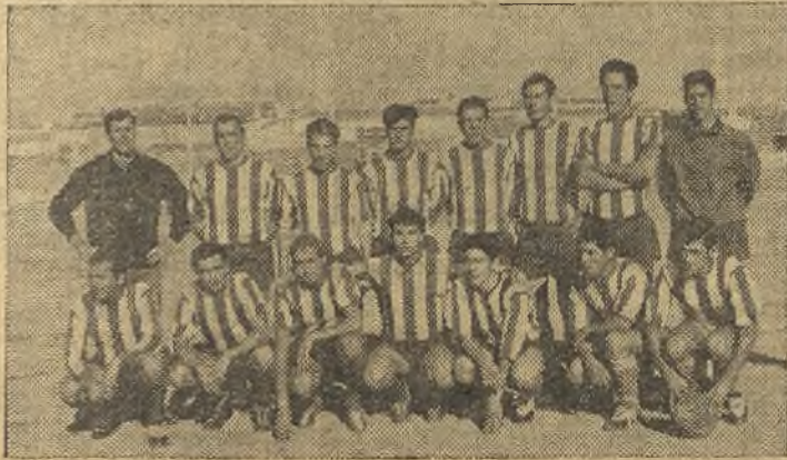
Parte del conjunto Almagreño, de la actual temporada.

—Absolutamente todos. Tenemos de Puertollano, Ciudad Real y Valdepeñas y varios de