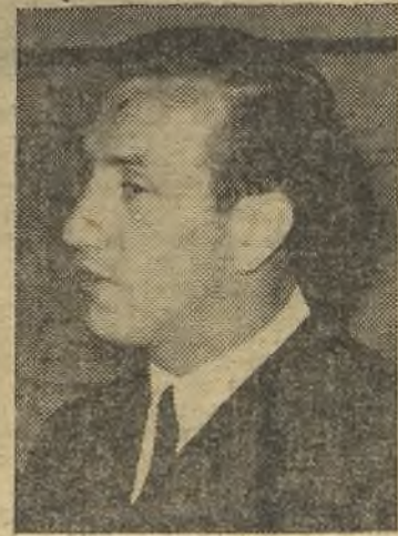
Noya debutó en Los Cármenes, pero aún le falta acoplamiento.

ambos bandos de conseguir resultados positivos. Ha habido una gran dureza, más acusada en la segunda parte en la que