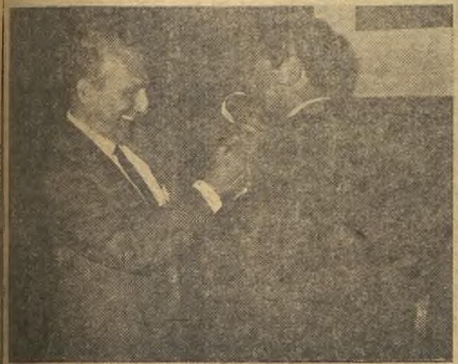
Momento de la imposición de la insignia de oro y platino