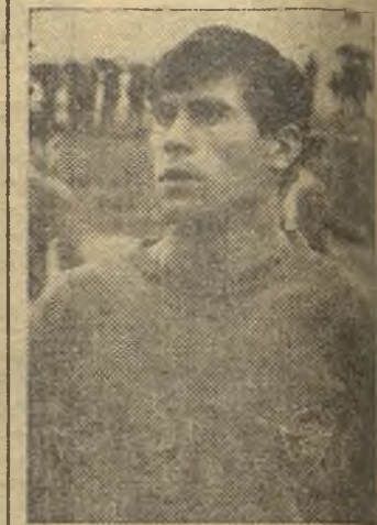
Agüilla, que, esta temporada, ha destapado en el Aranjuez

Aún habría tiempo para que se produjera un penalty al