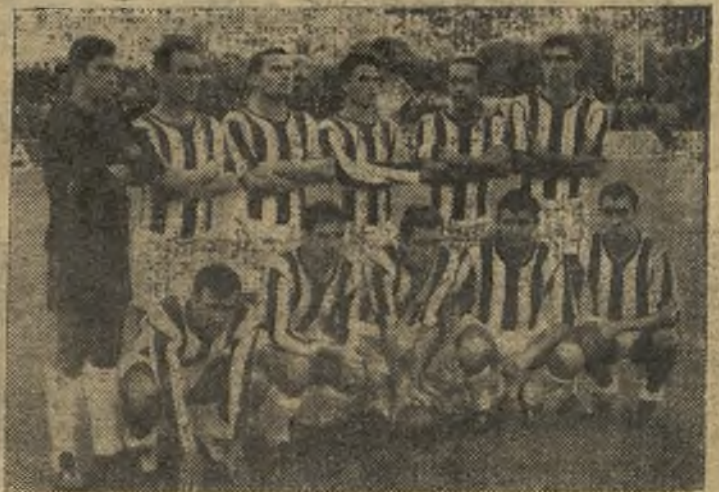
Todo el Badajoz funcionó como una perfecta máquina y, por tanto, destacó todo el equipo.

ción en el centro de la tabla, libre de peligros y exento de aspiraciones; en segundo, por que el estado del campo, be-