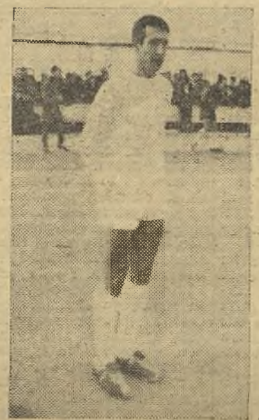
Luna, el mejor del Valdepeñas y sobre el terreno de juego

Boetticher: Intriago; Enrique, Herrero, Fernández; Rafa, Leta; Segundo, Salva, Luis Miguel y Moreno.