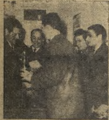
El alcalde de Valdepeñas hace entrega de los premios

BADAJOZ. (De nuestro corresponsal, Luis).