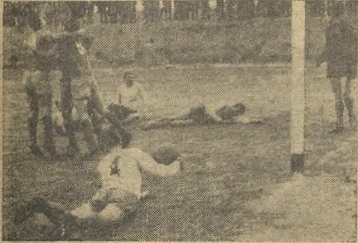
Hasta el segundo tiempo no marcó el Aranjuez su primer tanto. Cuatro, del Pedro Muñoz, caídos por los suelos (igual que las ilusiones mantenidas hasta entonces) y alegría en los encarnados del Real Sitio. (Información en la pág. doce)