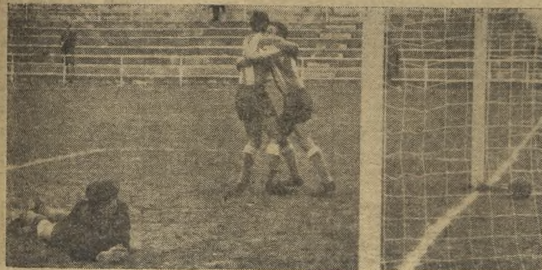
Balaguer ha captado así el segundo gol del Madrileño. Alegría en los gualda-morados, mientras el portero del Femsa contempla el balón en su red con cara de circunstancias. Pero la alegría del Madrileño sería a medias, ya que el Femsa le arrebató un punto en el propio estadio "Antonio Borrachero". (Información en la página trece)