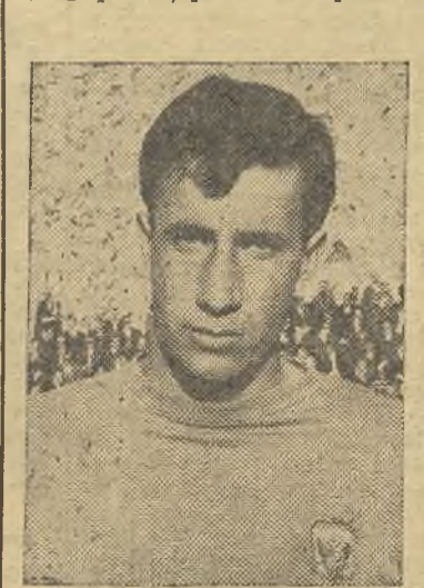
Sánchez Cabezudo debutó con el Talavera, el domingo

ro éste lo anula ante la sorpresa de propios y extraños; y de esta forma priva al Talavera de un punto, pese a las protes-