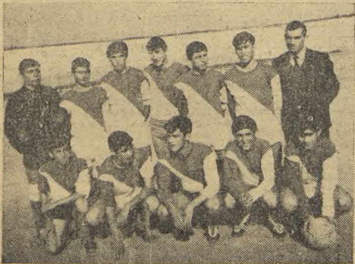
El equipo de las Escuelas "Hermano Gárate" que, con el nombre de Loyola, actuó en el pasado torneo juvenil.

años) y Olmo (17 años). Medios, Marchán (17 años), Marcante, 16 (años); y delanteros, Lozano (15 años), Delgado (15 años), Rubio (16 años), Castellanos (16 años), Ruiseco (17 años), Madrid (17 años) y Abad (17