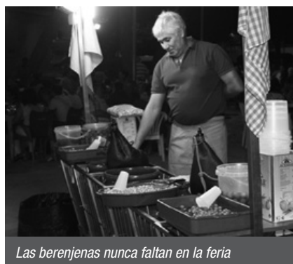
Las berenjenas nunca faltan en la feria