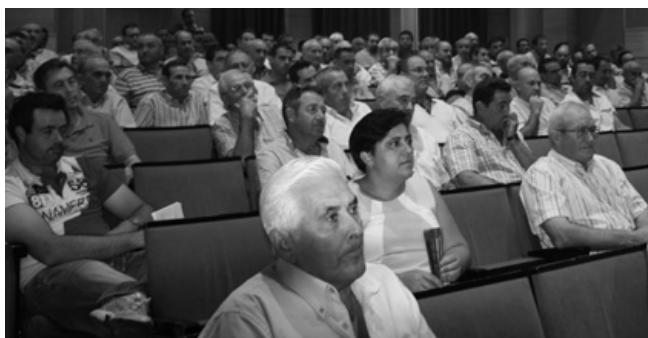
Socios de la cooperativa en la última asamblea