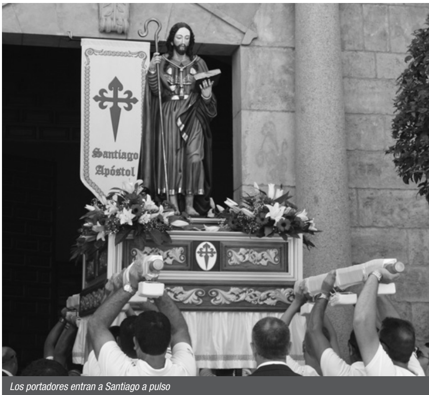
Los portadores entran a Santiago a pulso