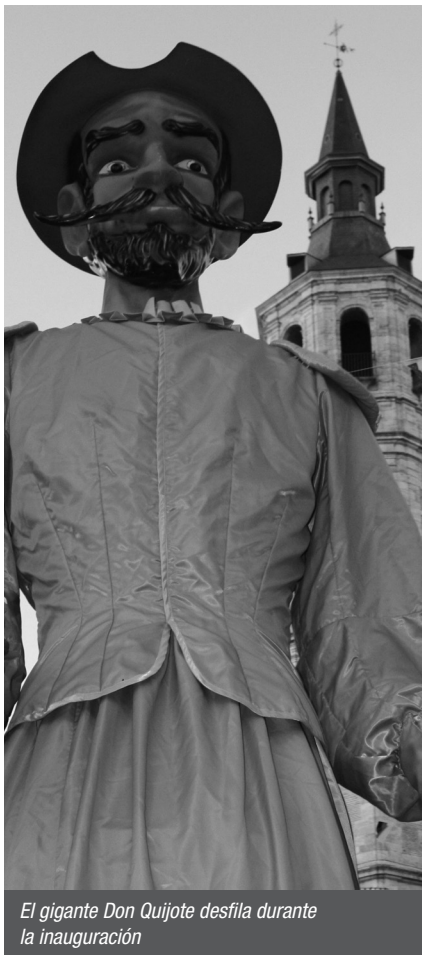
El gigante Don Quijote desfila durante la inauguración