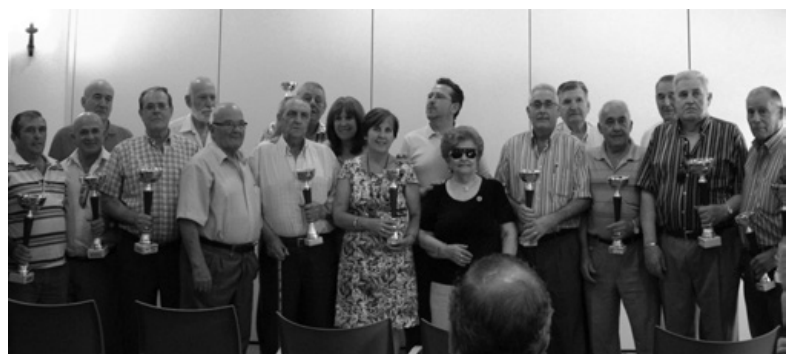
Ganadores concursos mayores

cumpliendo los objetivos iniciales: “disfrutar del ocio, del tiempo libre, conocer gente y pasarlo bien”. Animó una vez más a la implicación de los participantes en los múltiples juegos que se organizan a lo largo del año.*