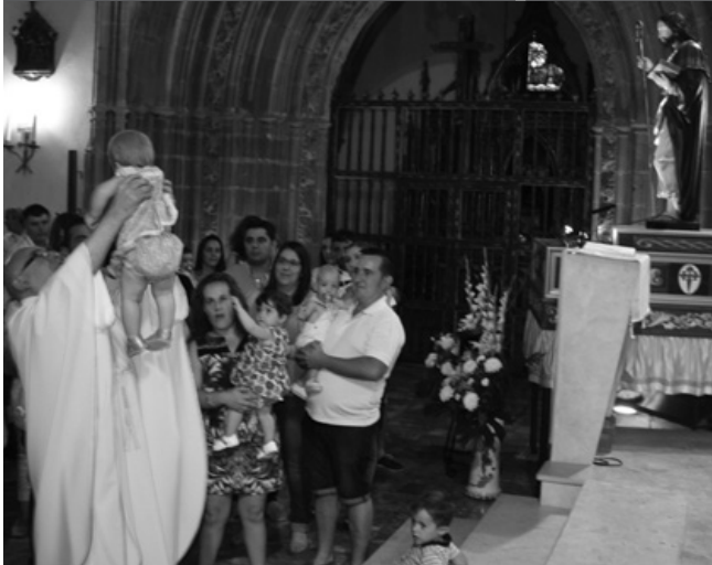
Un bebé es ofrecido al Apóstol Santiago

Buena parte de los niños bautizados durante el año fueron presentados al Apóstol, como viene siendo costumbre últimamente. El acto, ideado por la Hermandad de Santiago, cerró el triduo