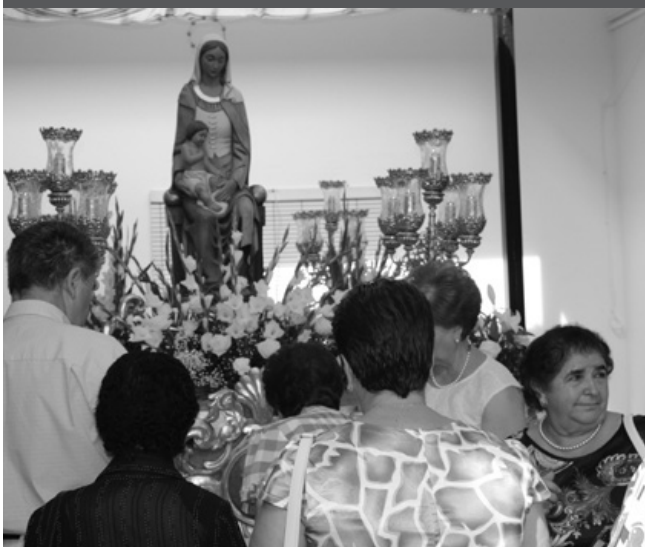
Ofrecimiento a Santa María del Parterre

La venta de flores y nuégados elaborados por los propios vecinos, así como las donaciones de fieles, dejaron unos 3.700 euros en las fiestas de Santa María del Parterre. Los actos se iniciaron un triduo y el sábado 15 de agosto se ofició la Misa Solemne, donde el coro titular