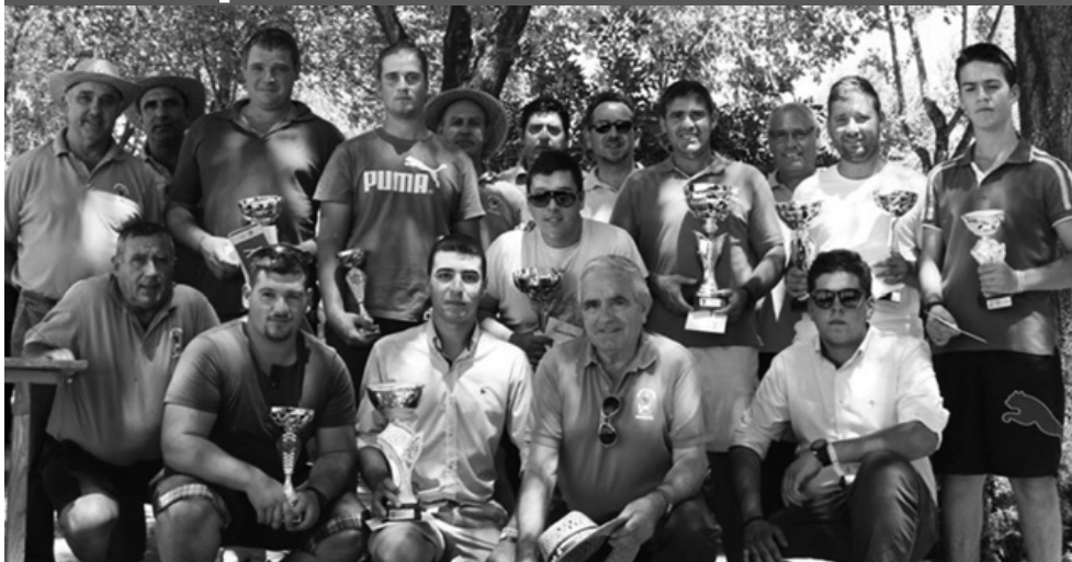
Ganadores de los concursos agrícolas

Asociación de Motos Clásicas celebró su XIV Concentración junto a la III Concentración Tractores Antiguos, muy vistosa, y la Peña Caballista llevó colorido con su pasacalle y la carrera de cintas. Tampoco faltaron actividades deportivas, de las que también nos ocupamos en la sección de deportes.