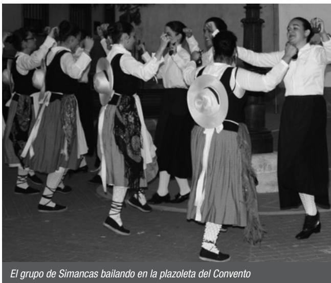
El grupo de Simancas bailando en la plazoleta del Convento

peranza” de Lillo (Toledo) desde el Jardinillo del Cristo del Amor. Todos llegaron a la plaza por distintas calles ante la atenta mirada de los espectadores que llenaban las terrazas y sillas habilitadas. Con los conjuntos en el escenario, el alcalde ensalzó el trabajo de estos colectivos por mantener vivas sus raíces folklóricas.