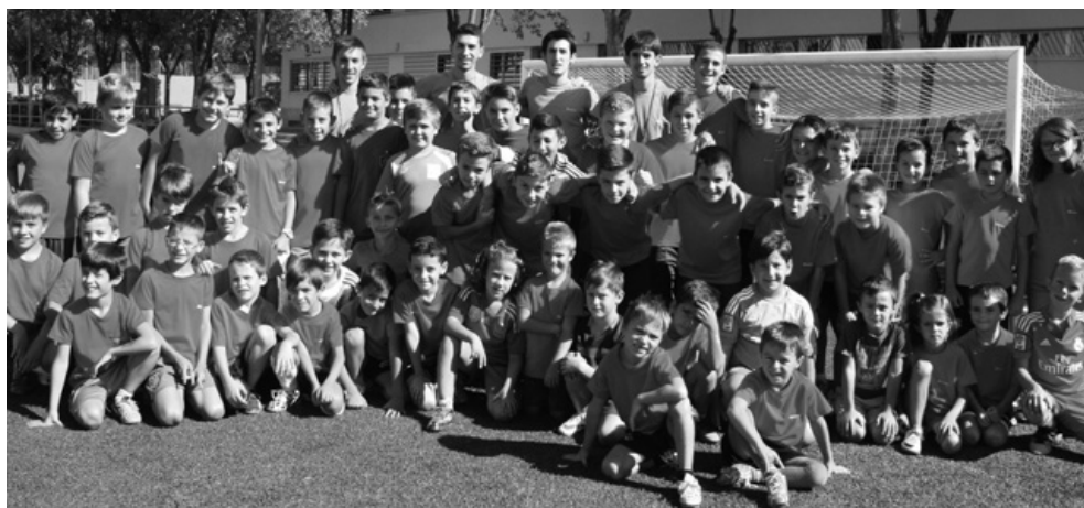
Alumnos del nuevo campus de fútbol-7