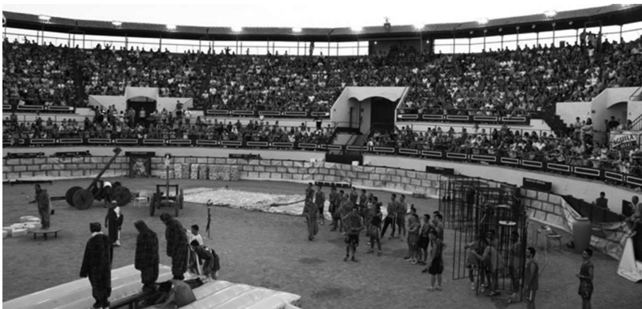
Aspecto de la plaza durante el Gran Prix