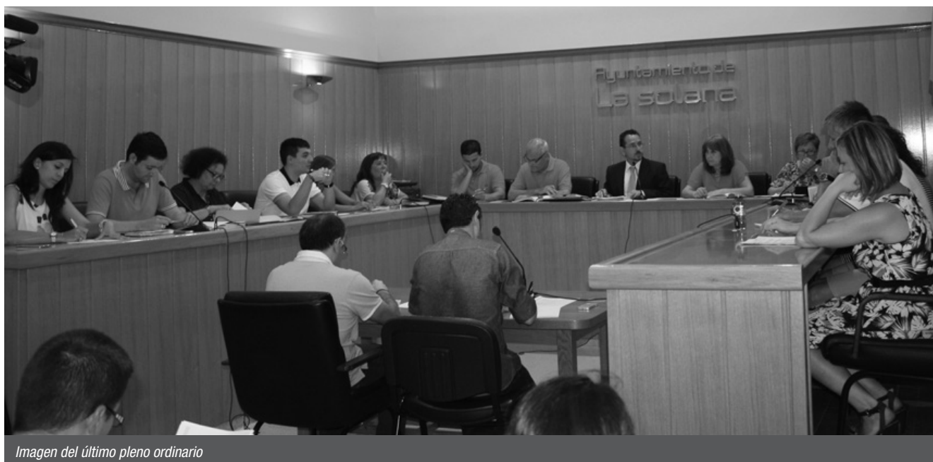
Imagen del último pleno ordinario