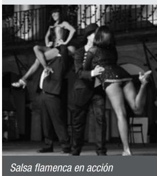
Salsa flamenca en acción

mañana del domingo 26 con sus concursos agrícolas, la