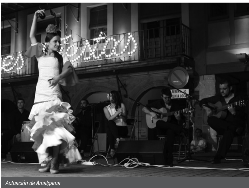
Actuación de Amalgama