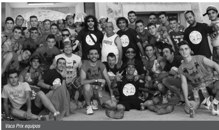
Vaca Prix equipos

La Solanera volvió a dejarse ver en la corrida principal de feria. Un buen número de socios acudieron juntos con sus camisetas. En la actualidad son 164 socios y 10 juveniles.