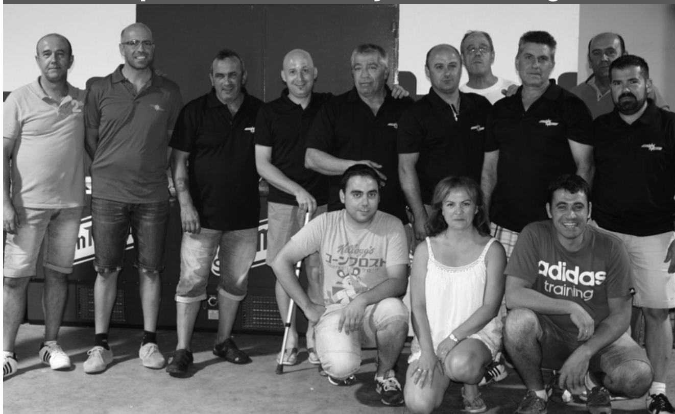
Transportistas de la Cooperativa Galanes