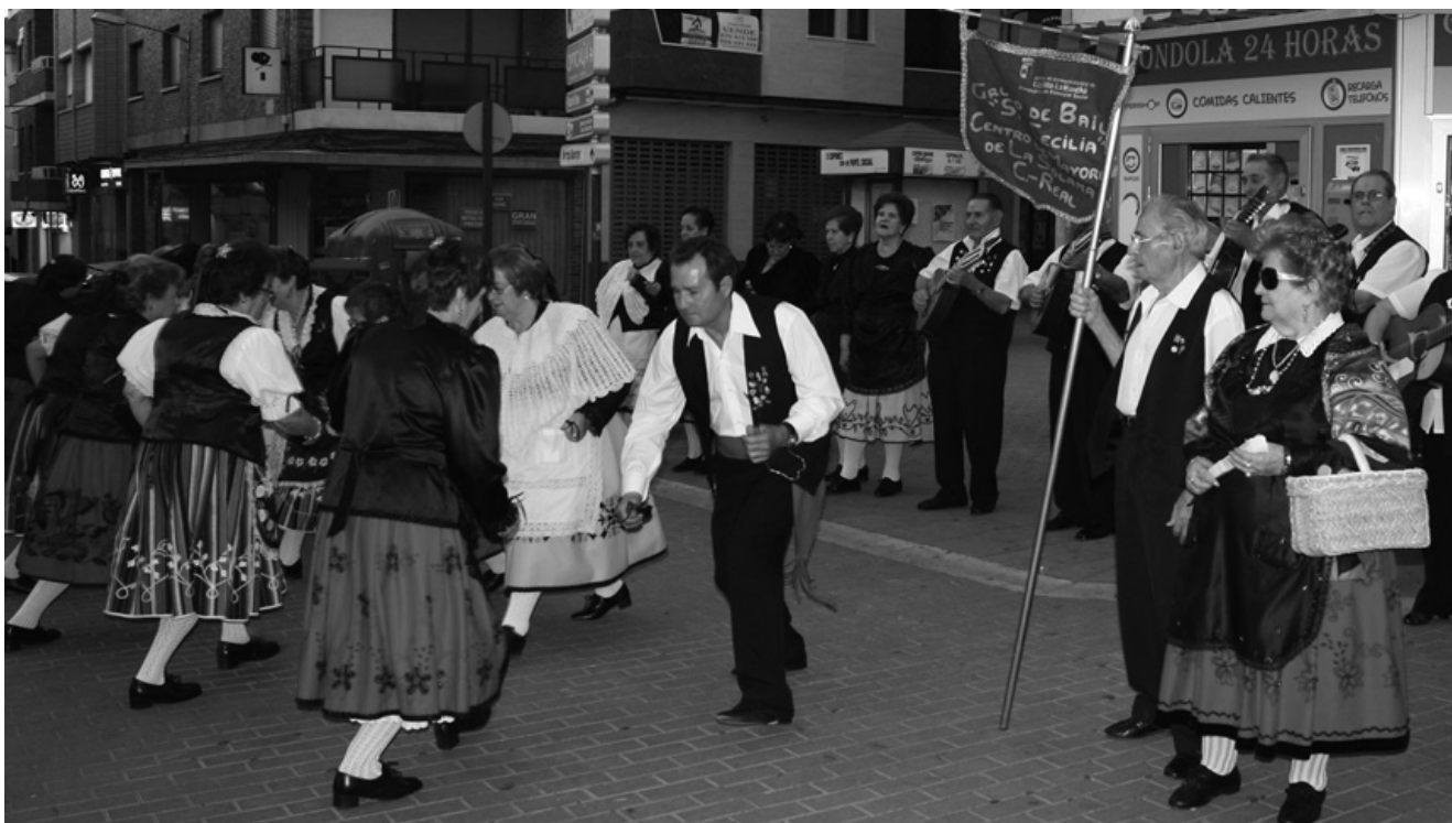
La rondalla Santa Cecilia bailando en la plazuela