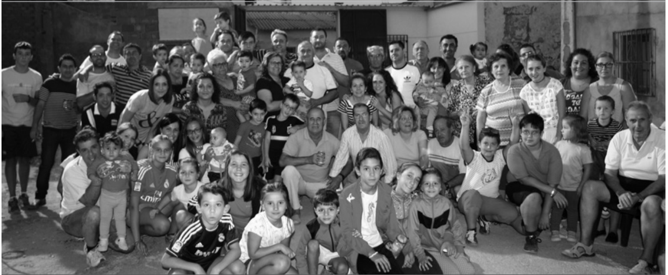
Los lobilleros posan alegres durante su fiesta agosteña