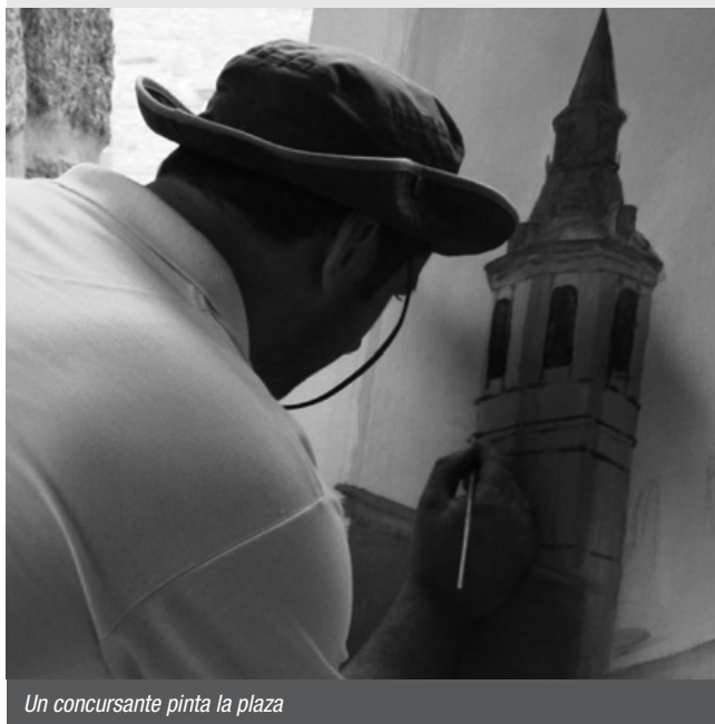
Un concursante pinta la plaza

el premio al poeta conquense Luis Auñón Muelas. “Ya no quedan Quijotes del amor y de la vida” –dijo– antes de leer su poema ganador, un canto a las virtudes que encarna el protagonista de la inmortal obra cervantina.*