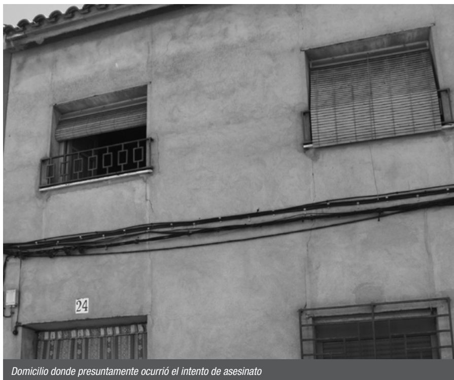
Domicilio donde presuntamente ocurrió el intento de asesinato