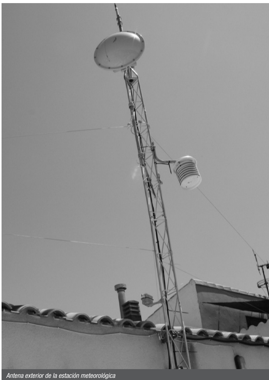
Antena exterior de la estación meteorológica

Por cierto, Chabot participa eventualmente en los programas “En camisa de once varas” y en “El pasacalles”