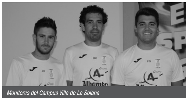
Monitores del Campus Villa de La Solana

El de fútbol en el albergue Vallehermoso ha tenido apenas una treintena de alumnos, aunque suficientes para disfrutar de una gran