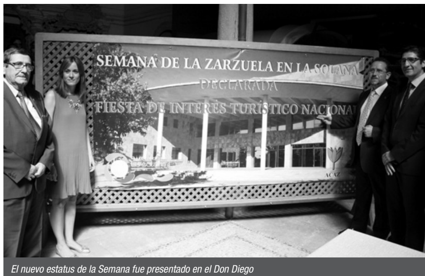
El nuevo estatus de la Semana fue presentado en el Don Diego

La primera edición bajo el nuevo sello se celebrará del 16 al 25 de octubre con un formato muy similar al de años anteriores. Se escenificarán cuatro zarzuelas, de las cuales tres clásicos como La calesera, El huésped del sevillano y, por supuesto, La rosa del azafrán. La gran novedad será el estreno en La Solana de La chulapona, zarzuela grande orquestada por Moreno Torroba y con libreto del solanero adoptivo Federico Romero. La pondrá en escena la compañía profesional Musiarte.