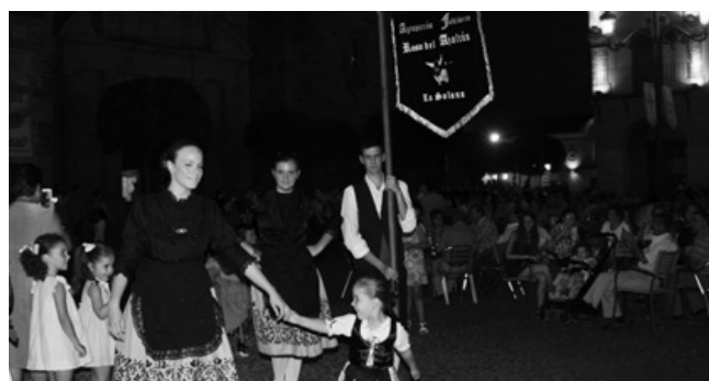
La Agrupación Rosa del Azafrán entró así en una plaza repleta

previamente en diferentes zonas de la localidad para llegar al escenario en un vistoso pasacalle. La Agrupación “Rosa del Azafrán” y su escuela infantil salieron desde el ágora de la biblioteca y la Rondalla “Santa Cecilia” desde la Plazuela de Canalejas. El Grupo de Jotas y Paloteo “Sietemancas” de Simancas (Valladolid) arrancó desde el Rasillo del Convento y la Asociación Cultural “Ntra. Sra. de la Es-