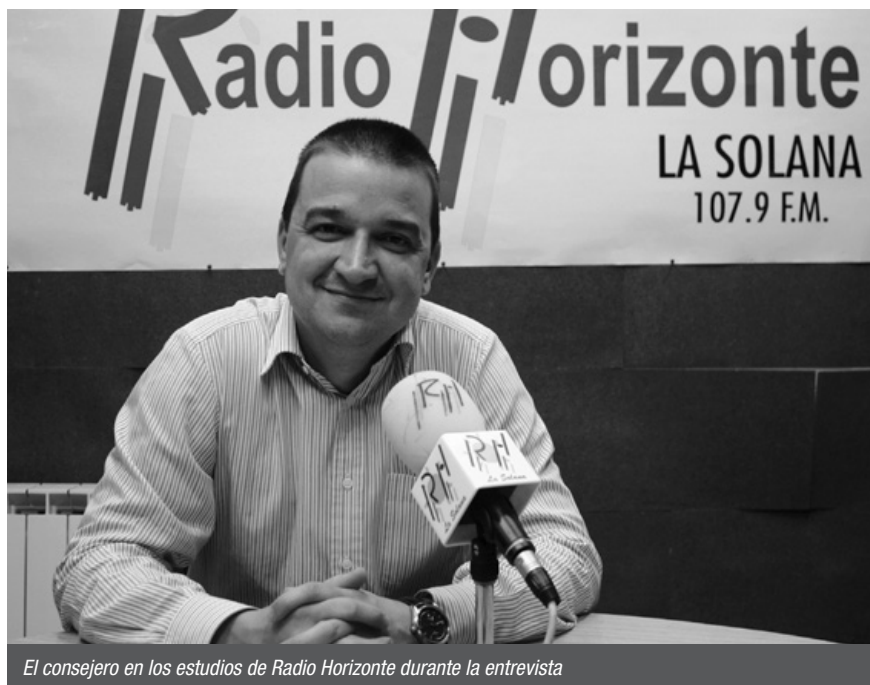
El consejero en los estudios de Radio Horizonte durante la entrevista