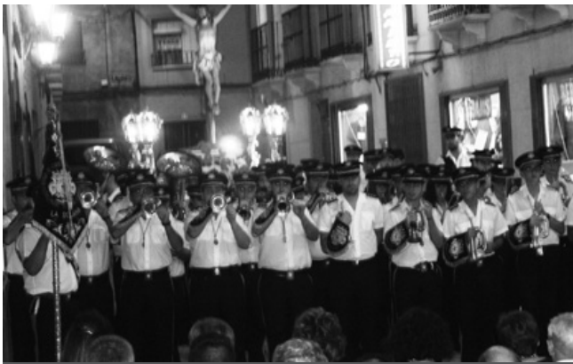
Actuación banda de Jesús

El Ofrecimiento al Cristo del Amor celebró este año sus bodas de plata en la popular barriada solanera. Organizado por la cofradía de la Vera Cruz y Virgen de la Esperanza, el 25º aniversario estuvo marcado por una masiva parti-