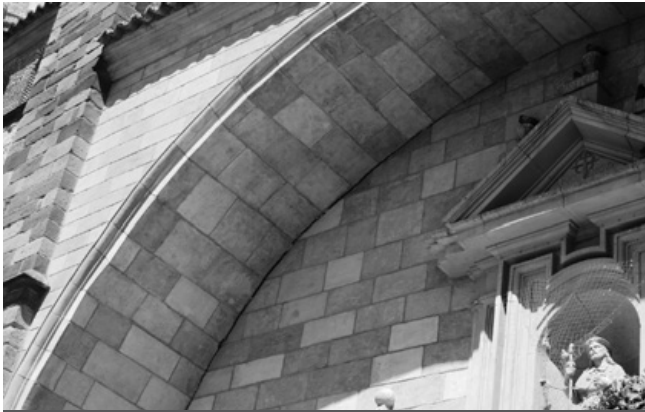
Pórtico de Santiago, donde se han hecho las primeras catas