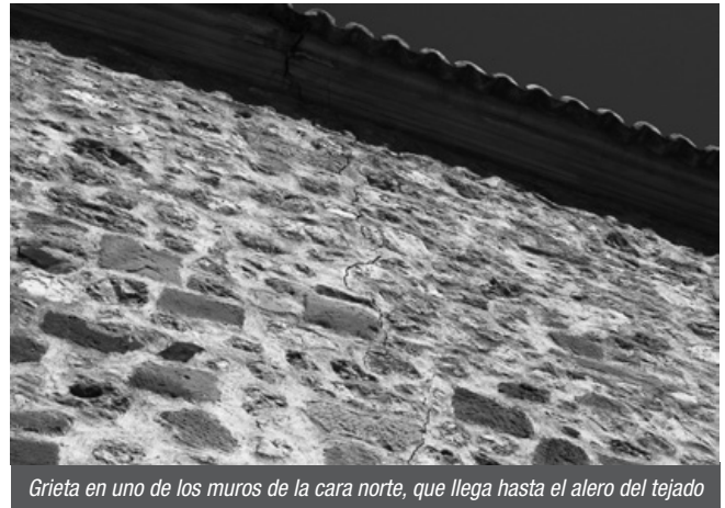
Grieta en uno de los muros de la cara norte, que llega hasta el alero del tejado

Sobre la financiación, contarán con los reducidos fondos de la parroquia, que también costean el crédito del retablo hasta 2025. Por ello, pide la colaboración de los solaneros.*