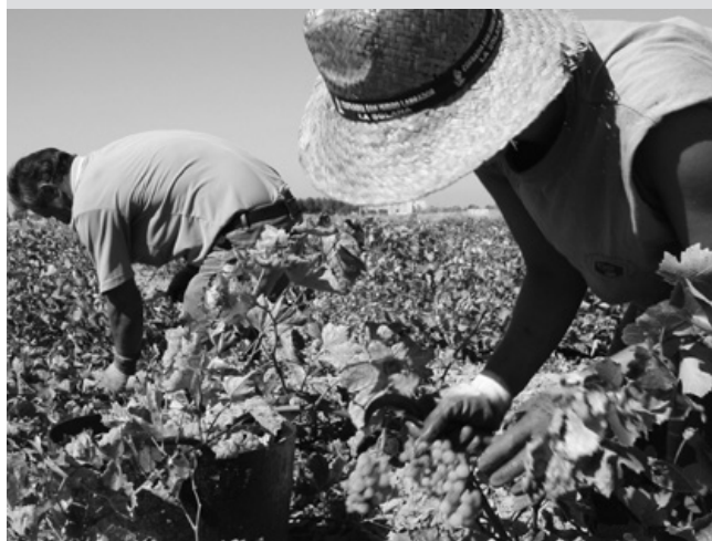
Vendimiadores solaneros en plena faena

hectólitros. Lógicamente, el secano se ha visto más afectado, lo que también trae aparejado menos necesidad de mano de obra. En algunas zonas de La Mancha ya se recolecta con medios mecánicos la mitad de la producción, sobre todo en regadío.*