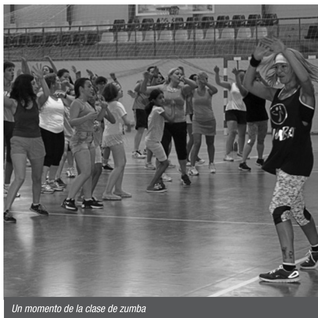
Un momento de la clase de zumba