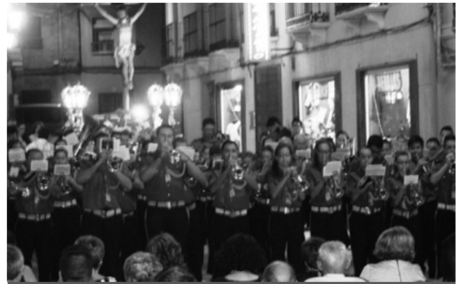
Actuación de la Banda de San Sebastián

Vera Cruz. La parte musical corrió a cargo de la coral y rondalla Santa Cecilia. Después se inició la venta de dulces y el ofrecimiento al Cristo. Por la noche se celebró la procesión, también multitudinaria. La recaudación final alcanzó 9.471 euros.*