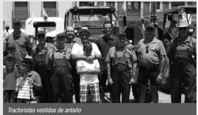
Tractoristas vestidos de antaño