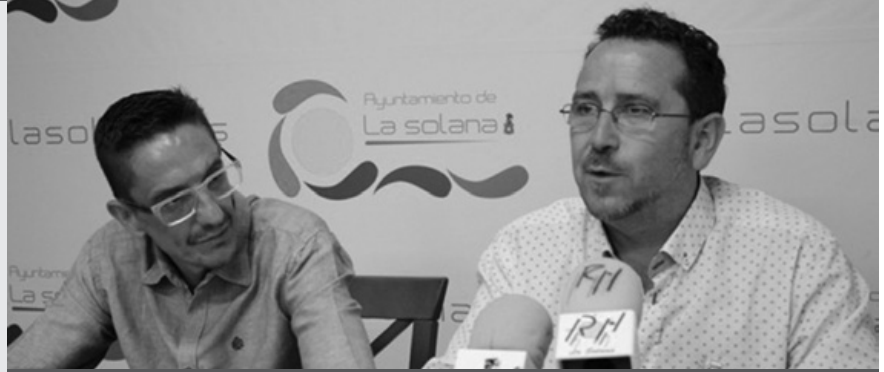
Presentación de la oficina contra los desahucios

El Ayuntamiento de La Solana acaba de poner en marcha un servicio de apoyo y asesoramiento contra los desahucios. Lo ha hecho a través de la apertura de una oficina gestionada por ACCEM (Asociación Española de Migración), una ONG especializada. “Creamos este servicio desde porque no hay mayor injusticia social que desalojar a las familias o personas más castigadas por esta cruel crisis”, declaró el regidor, recordando que da cumplimiento a un compromiso electoral. La oficina estará abierta en el Palacio Don Diego los jueves, aunque a demanda. Los interesados pedirán cita previa a través de los Servicios Sociales