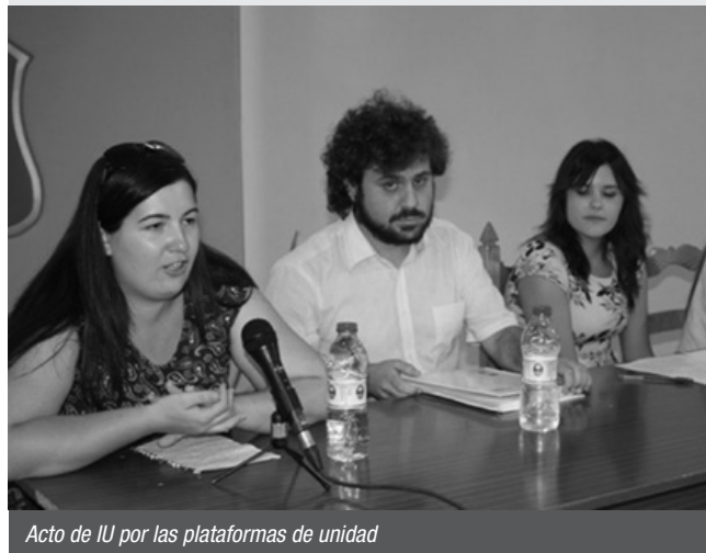
Acto de IU por las plataformas de unidad

hace falta “una respuesta política urgente para empezar a cambiar este país”. Esa respuesta pasa, dijeron, por construir estas plataformas de unidad popular “que han demostrado el 24-M ser garantía de éxito como alternativa real al bipartidismo”. *