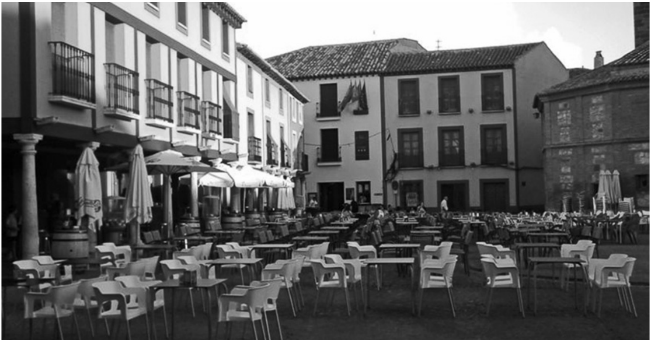
Terrazas en la Plaza Mayor