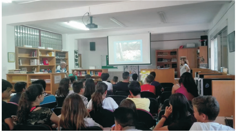
El alumnado siguió atentamente la charla.

Hablamos y les enseñamos a las alumnas y alumnos los escombros descontrolados que hay en varias zonas del barrio, no solo escombros de obras, sino tam-