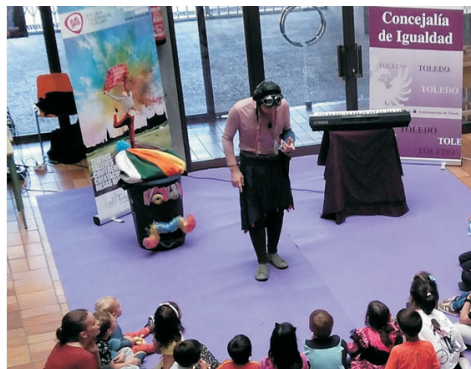
Instantánea del Cuentacuentos organizado por la Concejalía de Igualdad en la Biblioteca del barrio.