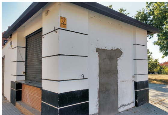
Quiosco del Paseo Poeta Manuel Machado.

Por todo ello, piden no se vuelvan a reabrir estos kioscos con este tipo de actividad y, en todo caso, si se reabriesen, que se hagan cumplir estrictamente los horarios, no autorizando horarios incompatibles con el descanso así