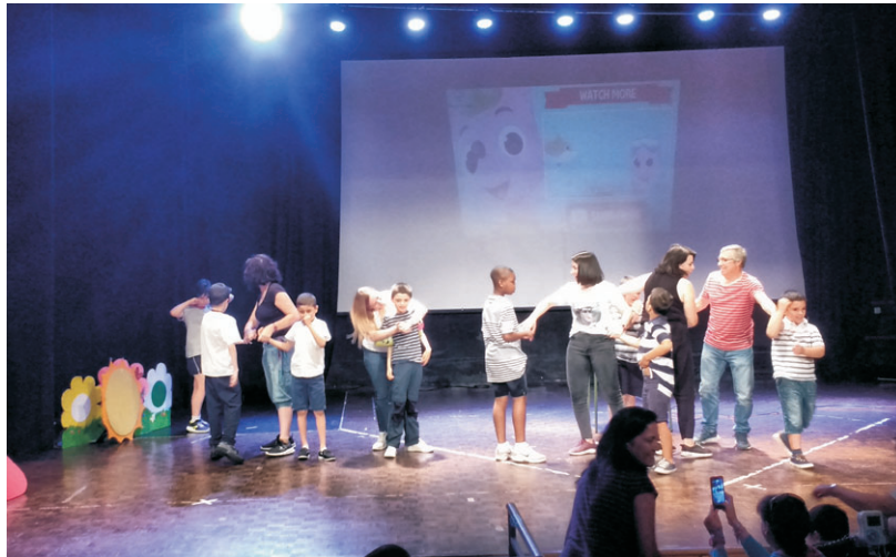
Actuación del alumnado del colegio Ciudad de Toledo, el pasado 19 de junio.

“En la última temporada hemos hecho una programación para la Sala Thalia por expreso deseo de la alcaldesa, comenta Plaza, que ha incluido cuatro