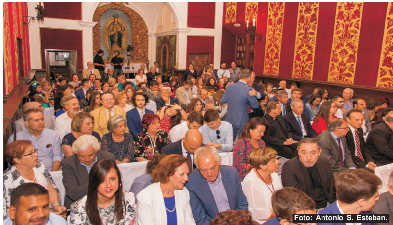
El público y autoridades abarrotaron la sala capitular del ayuntamiento.