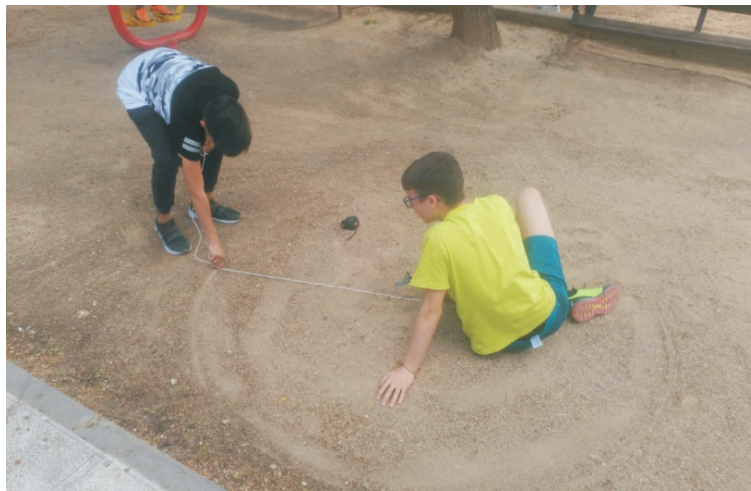
Aprendiendo a través del juego.

Desde el pasado mes de abril, los alumnos y alumnas de los centros escolares del barrio del polígono, cuentan con un nuevo recurso de apoyo educativo, el programa "ParticipaS", donde se les ofrece reforzar lo tratado en clase de una manera diferente. La selección de los participantes ha correspondido a criterios como el contexto sociocultural, económico o aptitudes de los alumnos y alumnas, llevado a cabo por los mismos tutores y equipos directivos de los centros colaboradores. Un total de 87 jóvenes vecinos del barrio han conseguido encontrar en esta propuesta una manera divertida y eficaz de mejorar en competencias como Matemática, Lingüística, Cívicas y Sociales o Aprender a Aprender.