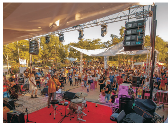
Los Alcázares acogieron el Sr. Blues Festival.

Las declaraciones de sus organizadores están en línea con los asistentes al festival. “Toda la gente que se pasó por el festival multiplicó la energía que desprendió el Sr. Blues durante todo el día. Solamente deciros que estamos muy felices por vuestra presencia e implicación con el Sr. Blues y que ha mere-