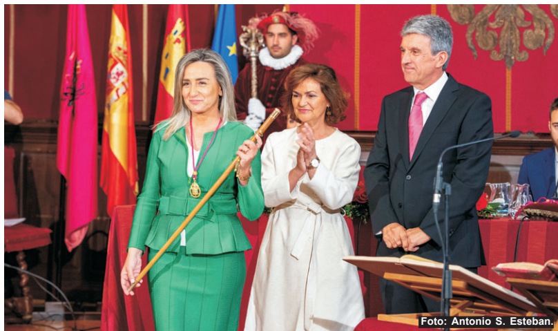
Milagros Tolón con el bastón de mando.

Milagros Tolón rememoró su compromiso de ser “la alcaldesa de todos los toledanos” y aseguró que en la nueva etapa “pretendo gobernar para todos con el único propósito de mejorar nuestra ciudad y la vida de sus vecinos” y aseguró que en los últimos cuatro años Toledo “ha crecido, ha cambiado y se está transformando para que sus ciudadanos vivan mejor”, gracias, dijo, “a una gestión económica prudente y eficaz”.