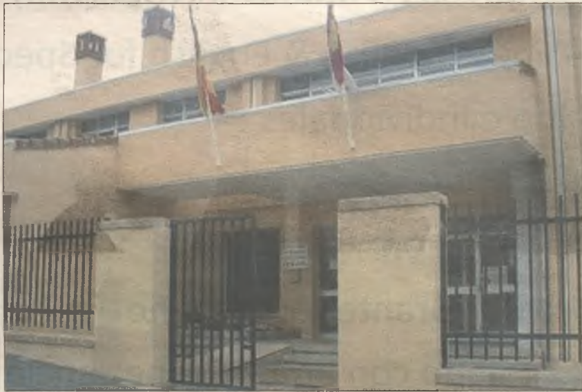
UN ASESOR. El CEIP Ocejón ha contratado a un asesor a través de Eulen

Según estas mismas fuentes, hasta este curso los asesores bilingües eran contratados directamente por la Consejería. De este modo, se tenían en