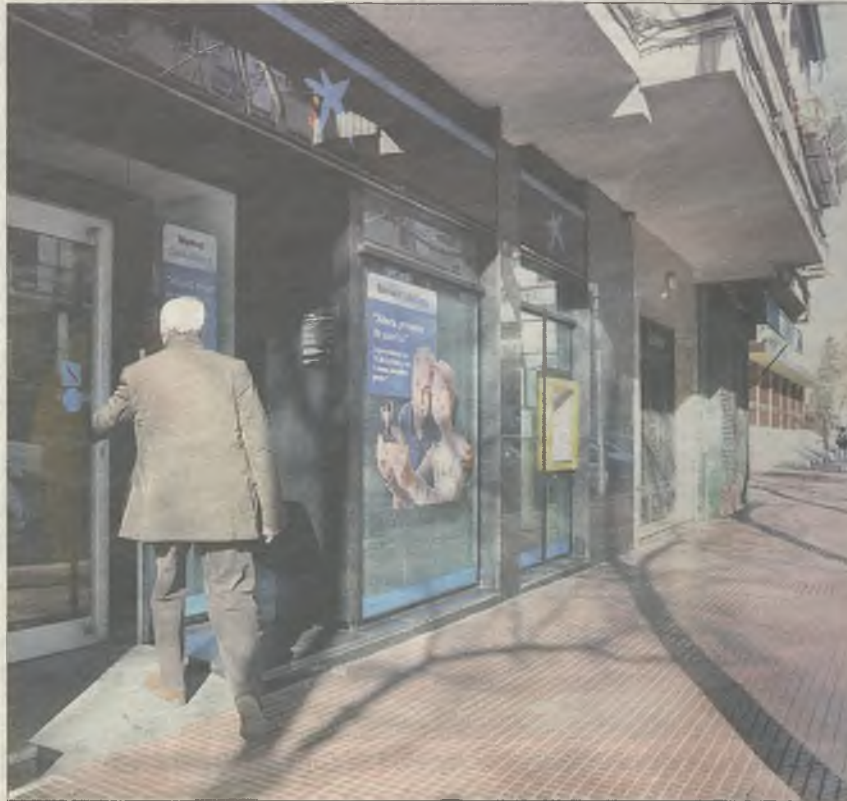
ATRACO. Los asaltantes solo pudieron sustraer 3.000 euros a un cliente

Tras amenazar con el arma en la cabeza a uno de los clientes, el mismo atracador zarandó a la directora del