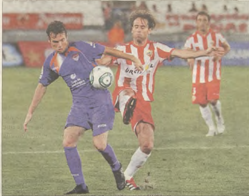
ALMERÍA. El CD. Guadalajara ya se enfrentó en Copa del Rey al Almería

El sin sabor viene porque nos quedamos con la sensación de que el equipo podría haber peleado por el partido según se desarrolló el mismo desde el pitido inicial. Pongamos nota como antiguamente: Sobresaliente en el arranque con un juego arrollador que sorprendió al rival; Notable en la efectividad de cara a gol en los primeros cuarenta y cinco minutos; Bien en la disposición táctica que propició dejar sin bandas al equipo ilicitano que es por donde terminó matando el partido; suficiente en la picardía que no consiguió el equipo para llevar el partido a su terreno cuando llegó a contar con dos ven-