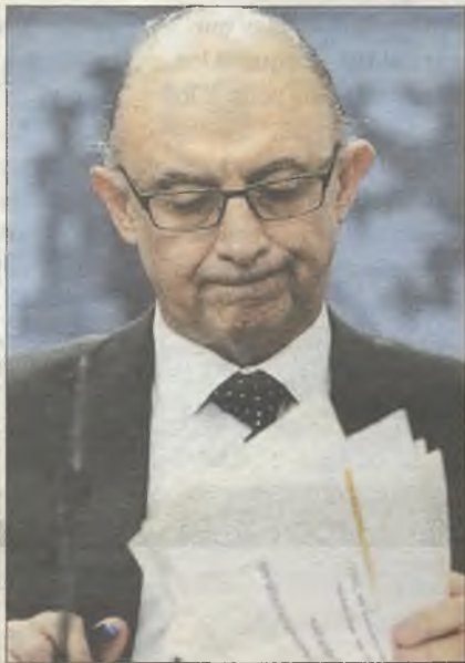
Montoro baraja si apostar o no

Al parecer, la fecha que más posibilidades cuenta es la inmediatamente posterior a las elecciones andaluzas del próximo mes de marzo, aunque apostar por una subida antes de esa fecha asegura un verdadero 'pelotazo'. "Yo aconsejo