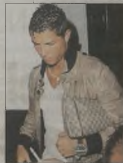
CR7 vistió sencillez en su primera consulta

The Cebolleta. La estrella del Real Madrid, Cristiano Ronaldo, está dispuesto a rectificar el carácter arrogante y caprichoso que está comenzando a pasarle factura incluso en el Santiago Bernabéu, donde ya