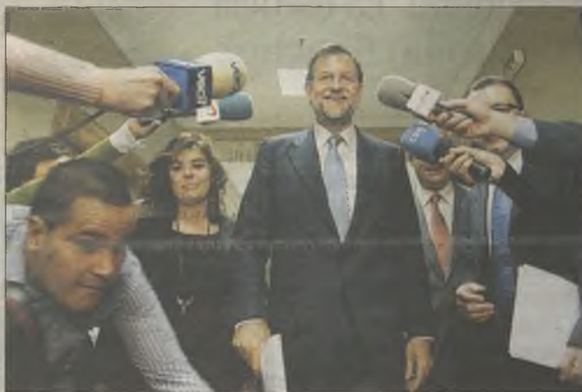
Rajoy y Soraya, el último día en que fueron vistos juntos

The Cebolleta. De los rumores maliciosos se ha pasado a algunos datos fehacientes sobre los motivos reales de la 'desaparición' de Rajoy de la primera línea. Y es que, según ha podido saber The Cebolleta , el presidente del Gobierno podría haberse pillado la baja maternal de su vicepresidenta Soraya Sáenz de Santamaría, en virtud del malestar físico y las necesidades de recuperación y cuidados que reconoce la Seguridad Social en las parejas masculinas de parturientas. Una interpretación flexible del reglamento ha permitido a Rajoy, como acreditado compañero de trabajo de Santamaría, disfrutar de la baja de su vicepresidenta. De hecho, algunos testigos aseguran haberle visto pasear con un carrito de bebé en los alrededores de Moncloa a la vez que leía el marca y fumaba un habano.