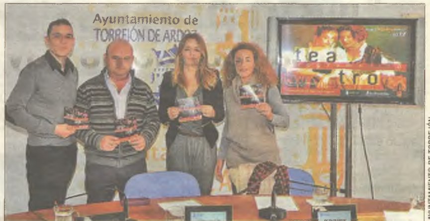
La programación trimestral del teatro municipal convoca a la élite artística

En estos primeros meses del año tendrán lugar tres estrenos nacionales, como La diosa impura , Bodas de sangre y Agosto . Además, se representarán