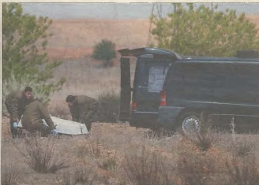
FALLECIERON EN EL ACTO. Las víctimas son un instructor y un alumno en prácticas

"Me paró el autobús en esta misma parada, en la carretera de Meco, venía a