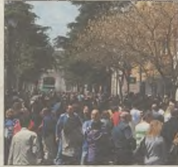
AYTO. SAN FERNANDO