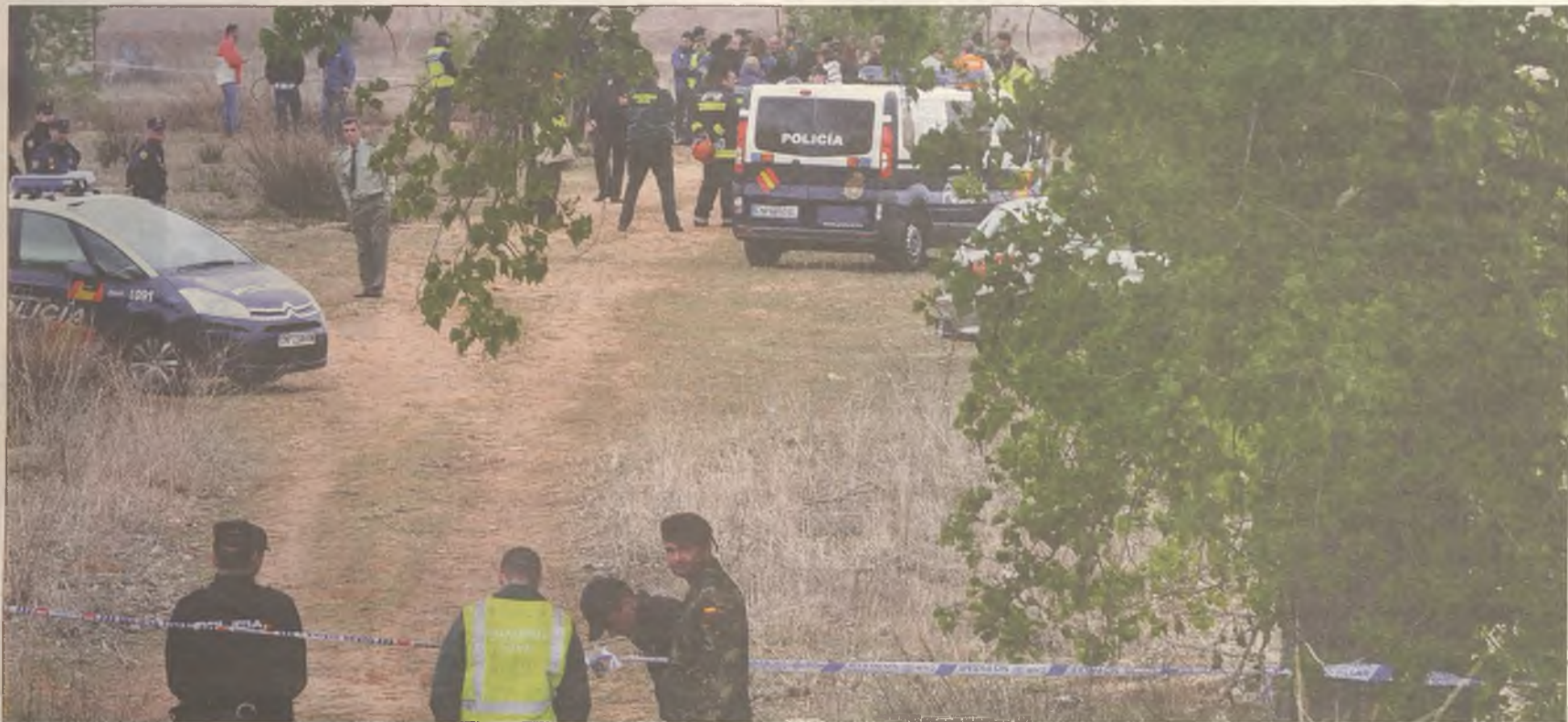
ACCIDENTE AÉREO. La aeronave, un avión biplaza utilizado para la instrucción, se estrelló en la mañana del jueves junto a la entrada a las cárceles de la M-121

DEL 27 DE ABRIL AL 3 DE MAYO DE 2012 www.dhenares.es