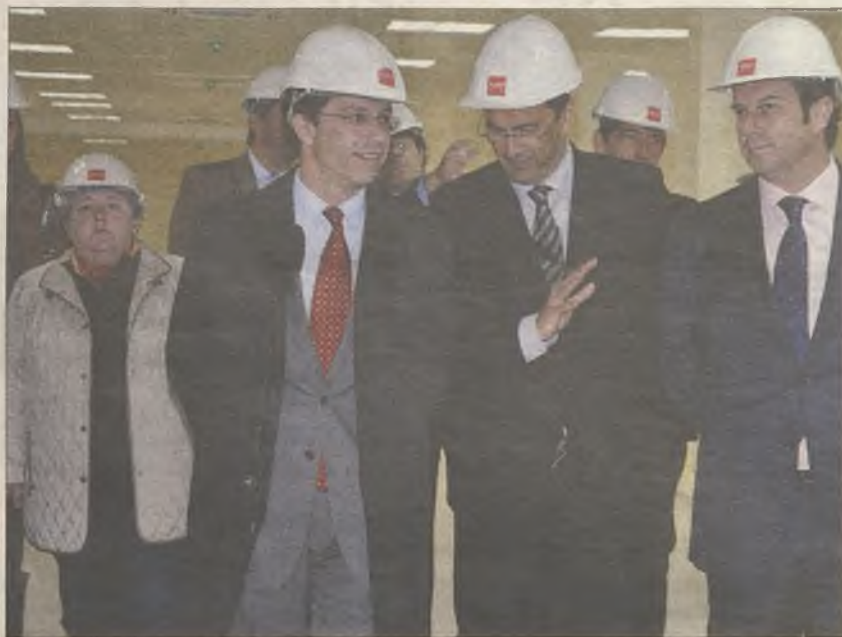
OBRAS. El consejero junto con el alcalde de Torrejón durante la visita al centro

Otra de las incorporaciones importantes es la Unidad de Salud mental y el Hospital de Día Psiquiátrico que se ubicará "en la tercera planta de