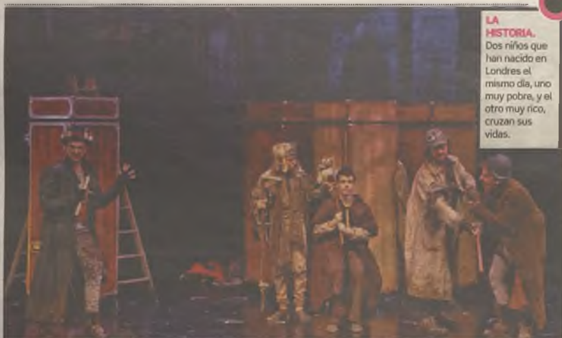
CANTY Y TUDOR. La vida de dos familias chocan en la Inglaterra del XVI