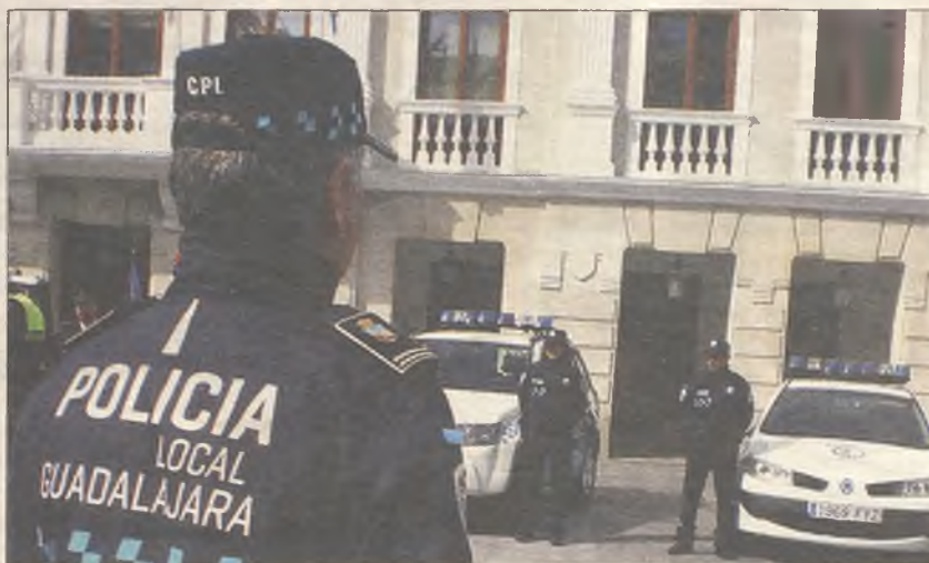
AES. De momento sigue vigente el convenio firmado en 2008