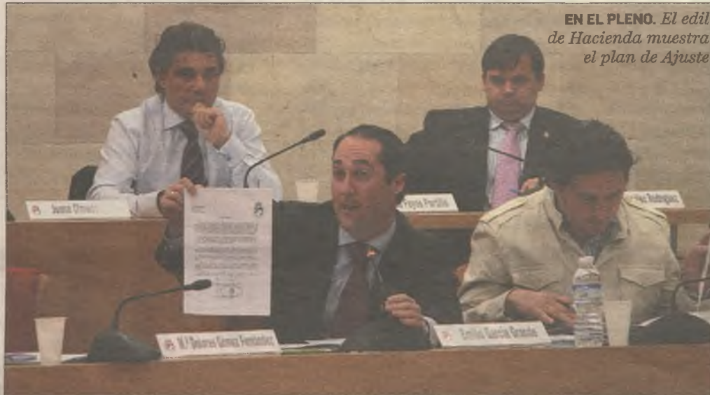
EN EL PLENO. El edil de Hacienda muestra el plan de Ajuste

"La situación me parece patética, patética por la actitud de la oposición. Nosotros no habríamos vuelto a traer este plan al pleno de no ser porque