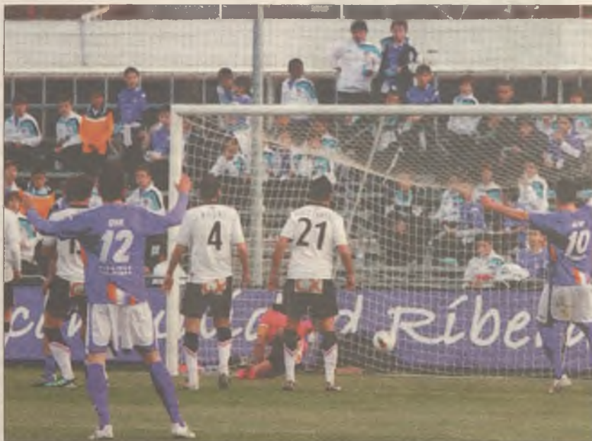
CUMPLIÓ. El CD Guadalajara pasó el examen y ganó al Nástic de Tarragona