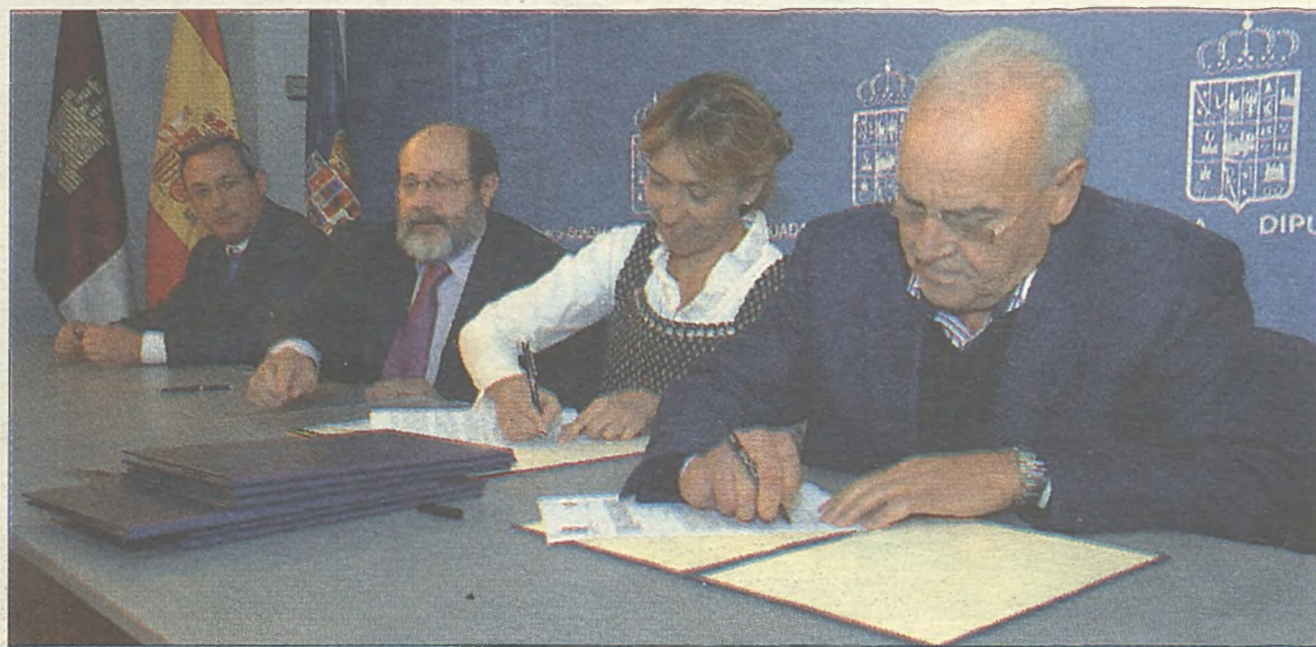
Momento de la firma del convenio con los responsables de las DO

La Diputación da 30.000 euros para su promoción