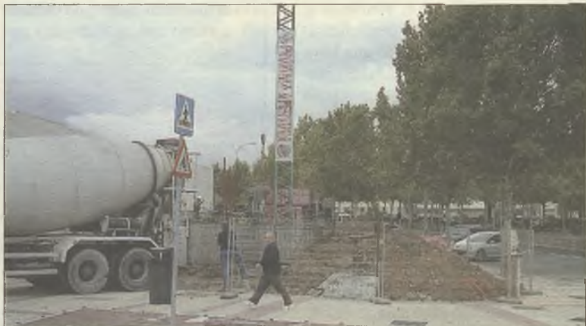
Parcela donde se están llevando a cabo los trabajos de cimentación

La apertura de este establecimiento supondrá la creación, "como mínimo, de