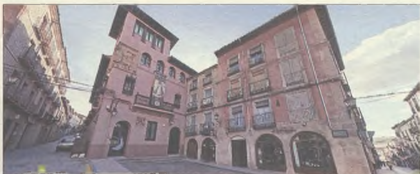
Imagen del tour virtual por la ciudad de Sigüenza

Sigüenza dirige una mirada de 360 grados a Internet para promocionarse turísticamente