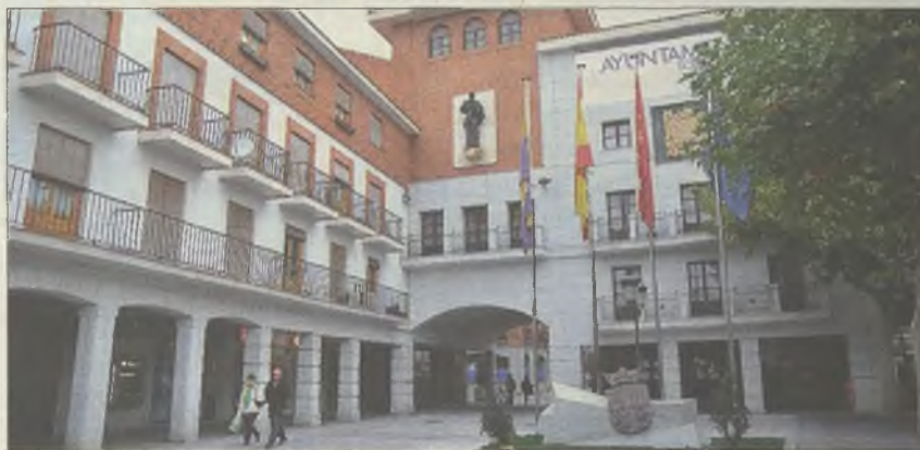
En la imagen, el Ayuntamiento de Torrejón de Ardoz

En cuanto a las bonificaciones, se eximirá del pago del IBI, como ya ocurre