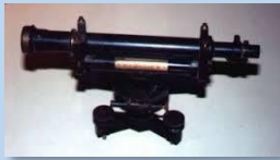
Instrumento topográfico (S.XIX)