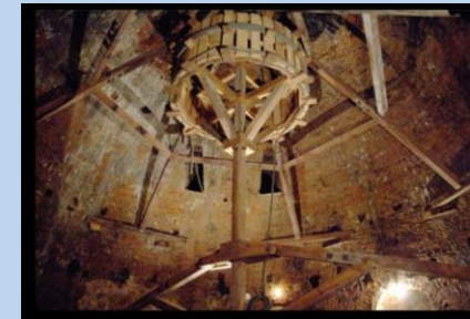
BARITEL DE SAN ANDRÉS (S.XVIII)