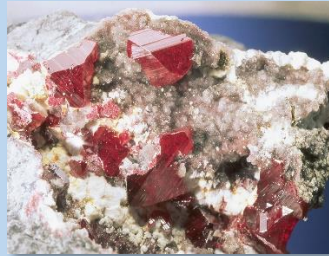
CRISTALIZACIÓN DE CINABRIO

El patrimonio geológico está unido al patrimonio minero, ya que las explotaciones mineras se llevan a cabo sobre los yacimientos minerales y las rocas, y éstos a su vez con el patrimonio histórico, arqueológico e industrial.