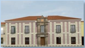
Casa Academia de Minas (S.XVIII)

Siempre que hablemos de Patrimonio, nos remontamos al pasado, a la historia... Esta herencia se compone de una gran variedad de cosas: inmateriales (formas de trabajar, nuestra lengua, recuerdos, fiestas, canciones, etc.) o materiales (edificios, libros, planos, objetos arqueológicos, etc.).