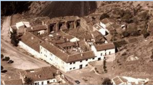
Antiguo Cuartel de los Carabineros construido sobre la “Crujía”

A mediados del siglo XVI, el auge en la explotación de las Minas de Almadén, hizo que surgiera la preocupación por la asistencia sanitaria para tratar a los azogados, creando para ello la enfermería en la Cárcel de Forzados o “Crujía”, que era atendida por un médico y un cirujano nombrado por el Superintendente de las minas.