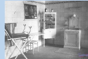
Sala de curas del Hospital (años 60 de siglo XX)

El edificio del Hospital tiene planta en forma de “L”, con el cuerpo de mayor tamaño dispuesto en paralelo a la plaza y con jardín en la parte posterior. Destaca del edificio la fachada, abierta con regularidad y con la calle central de ladrillo macizo visto, más decorada y rematada con una hornacina que cobija un Arcángel San Rafael.