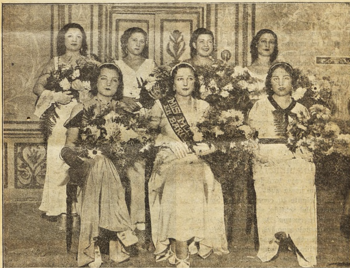
Miss Murcia 1934-35, rodeada de su Corte de Honor

Redacción y Administración: Nueva de San Francisco, 11 y 13-Tel. 21127