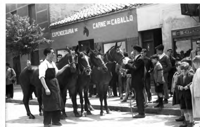
Expenduria de carne de caballo, 1965.