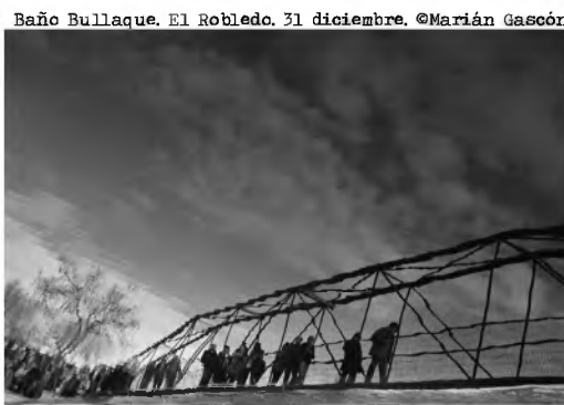
Baño Bullaque, El Robledo, 31 diciembre

FANZINE NUM.9-FEB.2014 www.alumbrefotografia.com Calle Palma 7, Ciudad Real