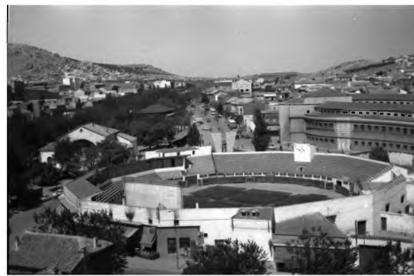
Plaza de toros, Puertollano 1956

Ramón Peco - Fotógrafo licenciado en periodismo.