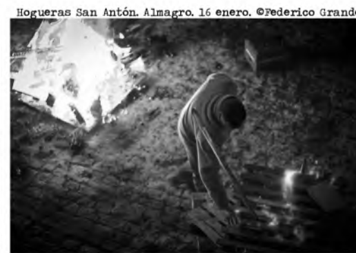
Hogueras San Antón, Almagro, 16 enero