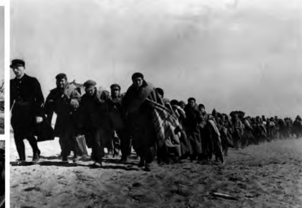
foto1.- Campo de bram 1939 ©Agustí Centelles. foto2.- 15 enero 1939. En el camino de Tarragona a Barcelona. (Algunos refugiados fueron asesinados o alcanzados por las bombas fascistas mientras huían). ©Robert Capa. foto3.- 25 enero 1939 Frontera Barcelona-Francia. ©Robert Capa. foto4.- Refugiados españoles en Francia, 1939. ©Robert Capa.