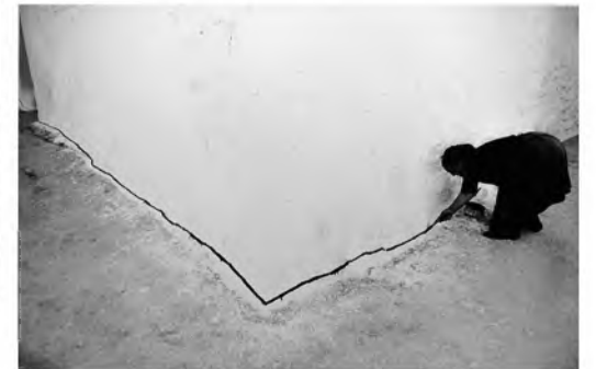
Tomelloso 1960