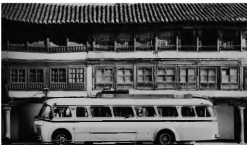
Almagro 1965