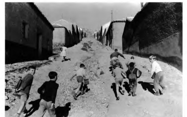
Puertollano 1963

El realismo documental español representado por Ramón Masats, Xavier Miserachs, Francisco Ontañón, Paco Gómez, Gabriel Cualladó entre otros, se dieron a conocer a través de Afal. Casi todos ellos fotografiaron los territorios manchegos durante los años sesenta dejando un legado maravilloso de sus pueblos y de sus gentes. No sabemos si nuestras instituciones culturales, más interesadas en publicaciones de gran continente y poco contenido, complacientes con lo estético y distantes de la esencia, han pensado que parte de estos trabajos podrían formar parte de nuestro patrimonio cultural. Las autoridades de la dictadura no perdonaron la independencia y el sentido crítico de este colectivo de fotógrafos y en 1963 Afal perdió su rebeldía y dinamismo hasta su desaparición.