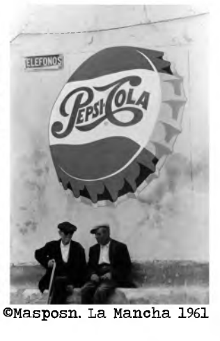
La Mancha 1961