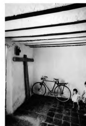
Moral 1960