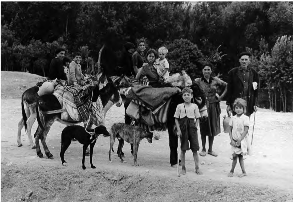
La Mancha 1961