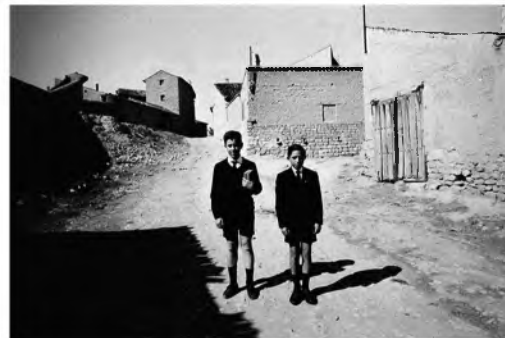
Criptana 1965