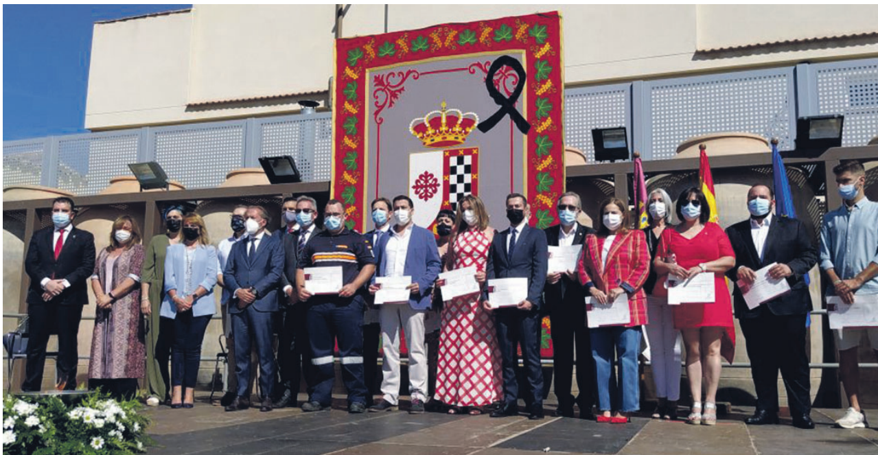
Foto de familia del acto de homenaje a los colectivos que lucharon contra la pandemia