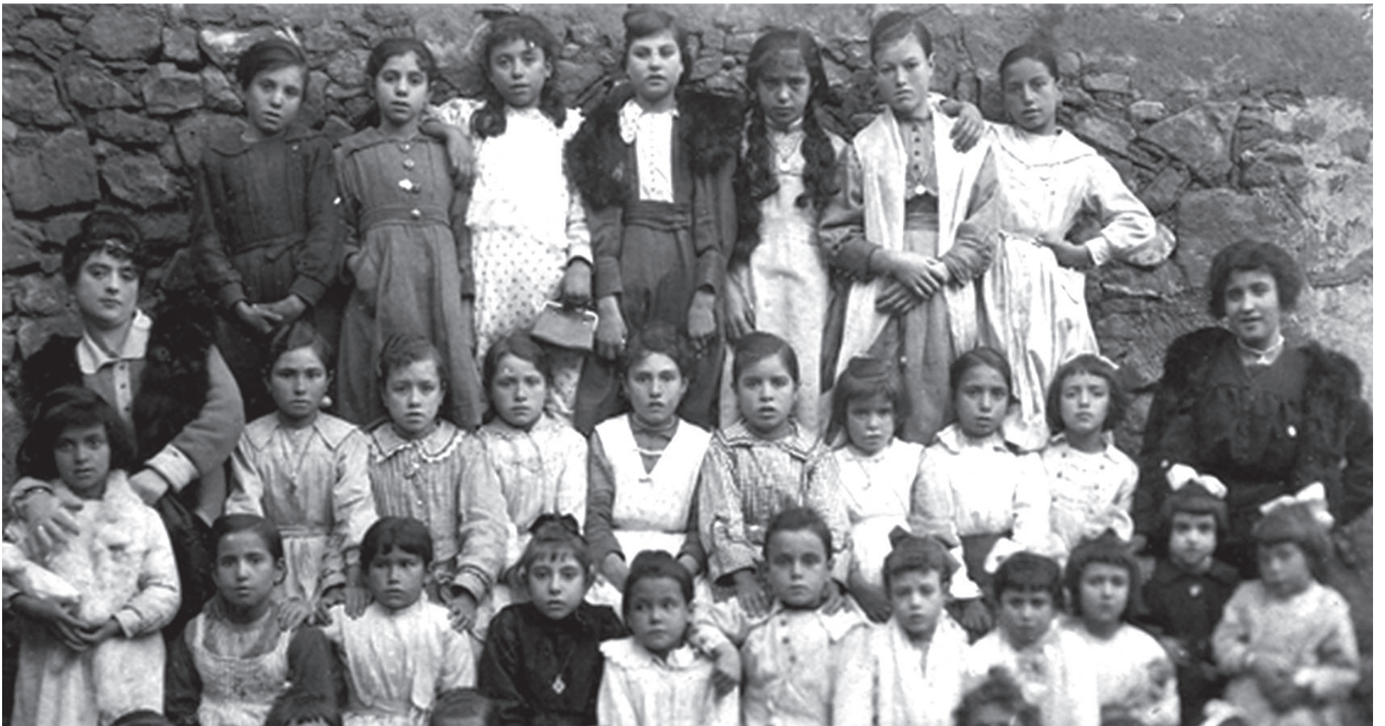
Escuela de niñas de la Torre, en la década de 1910-20. Quizás entre ellas se encontraba Manuela