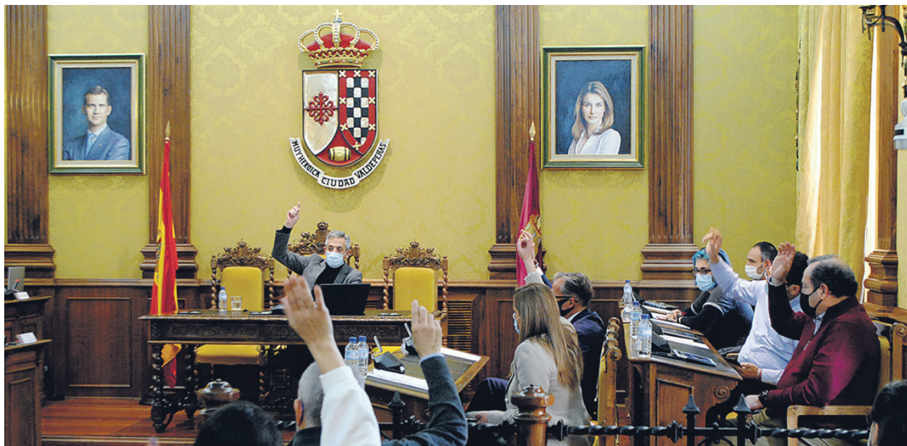
El Pleno de Valdepeñas de marzo/ Lanza

Además, el Consistorio contempla una inversión de 300.000 euros, a cuenta del superávit, para el pro-