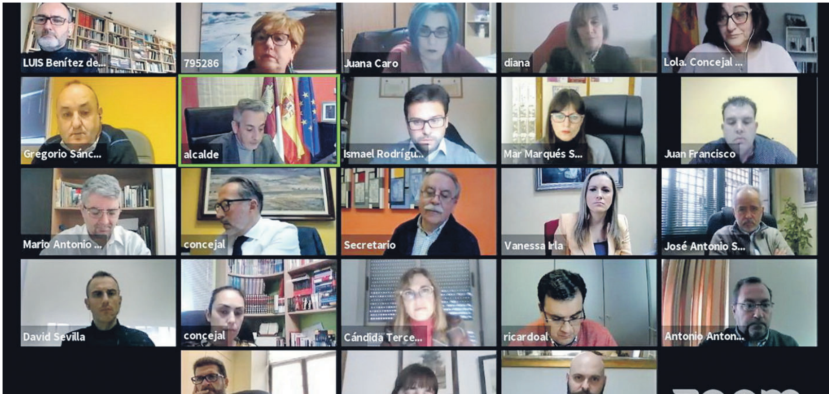
Momento del Pleno

EL SECTOR PRODUCTOR DE LA D.O. VALDEPEÑAS PRESENTA SU BAJA DE LA ASOCIACIÓN INTERPROFESIONAL