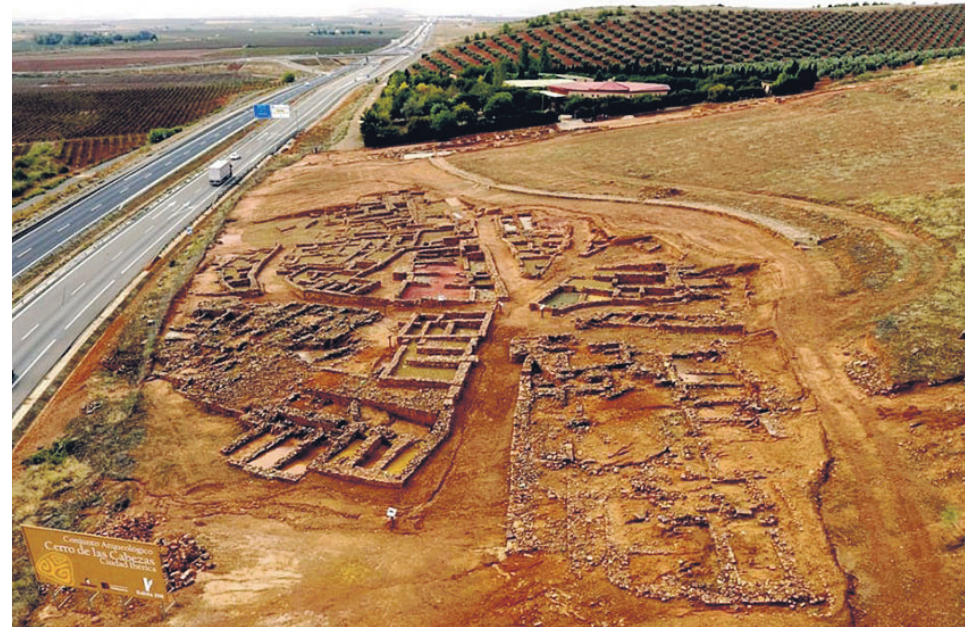
El Cerro de las Cabezas de Valdepeñas / Lanza