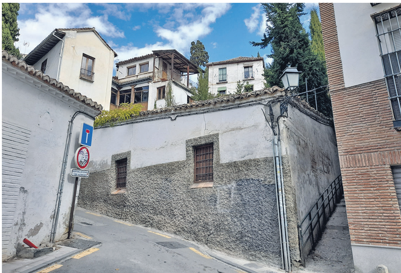
Cementerio de Santa Escolástica, 9, donde vivía

cuando la situación se hubiese calmado. Pero no fue así, la situación derivó en una guerra civil con terrible matanza; tardaron dieciocho años en regresar a España, prácticamente como apátridas.