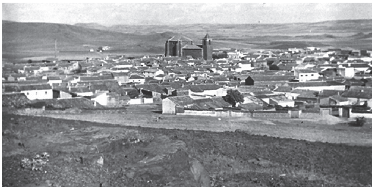
Panorámica de Torre de Juan Abad a principios del siglo XX. Por entonces tenía una población algo superior a 2.500 habitantes