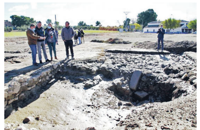
Visita del alcalde al yacimiento de El Peral

llado cuando comenzaron las obras de la rotonda en la zona y ha destacado el testimonio que da de la industrialización del vino en el mundo romano en este enclave. "La geolocalización permitirá conocer nuevas estructuras".