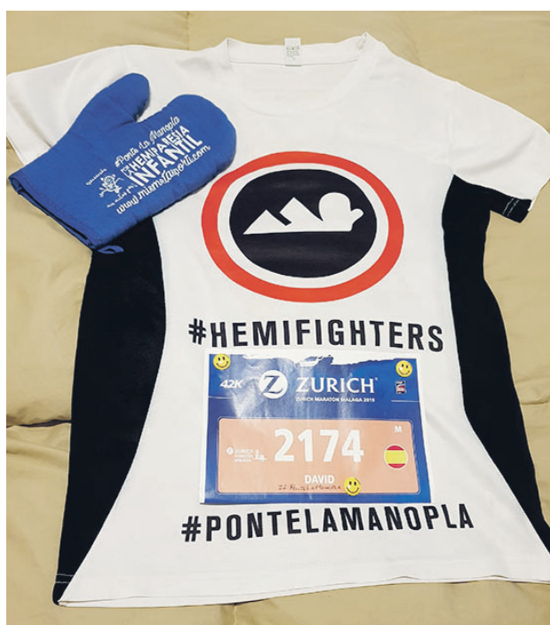
Camiseta y manopla de cocina de la Asociación