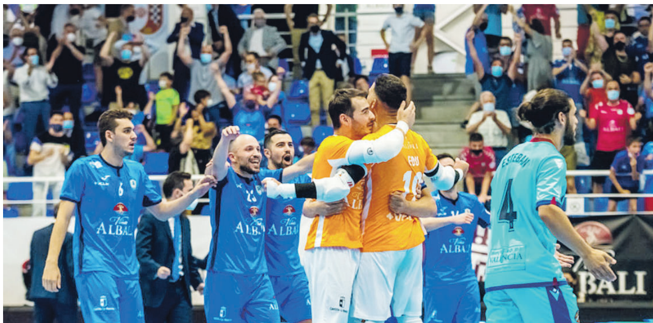
Varios jugadores del Viña Albali celebran el triunfo ante el Levante en el segundo partido de 'semis'

El equipo azulón volvió este pasado 2021 a codearse con los grandes