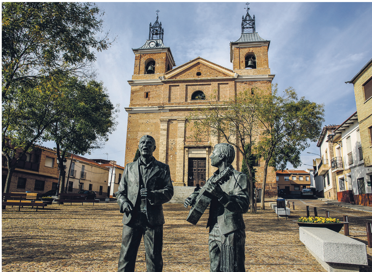
Imagen de Piedrabuena en la actualidad

Si en todo hay una causa primera, en este caso hay que buscarla en la pasión del geólogo alemán Franz Lotze (1903–1971) por la Península Ibérica y su estructura geológica. Coetáneo de nuestro F. Hernández-Pacheco, llegó a España en 1927 para dedicar su atención, con un trabajo de campo intenso, a la paleografía y la tectónica del Paleozoico en la cordillera Cantábrica. Extendió luego su interés por el Macizo Ibérico, siendo en ello pionero y avanzando tesis, como la división de la península en zonas geológicas, que se siguen considerando en la actualidad. Se estableció con posterioridad en España, a la que consideró segunda patria (1937–1941), combinando sus trabajos de investigación con actividades profesionales en la minería. Tras la 2GM, Franz Lotze fue nombrado catedrático de Geología en la Universidad de Münster, desde allí seguiría con su dedicación al estudio geológico de nuestro país. Desde su cátedra coordinaría el trabajo de los alumnos en las zonas que él no pudo visitar: Desde el Tajo a Sierra Morena.