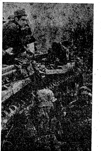
Tanques alemanes esperando el momento de iniciar el ataque ordenado por el mando