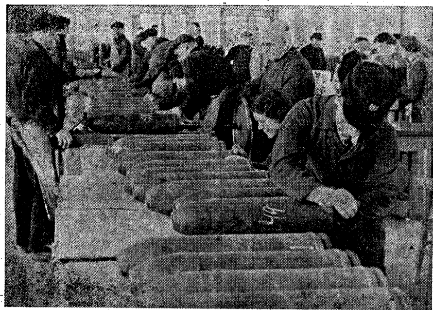
La producción en las fábricas de guerra alemanas, se intensifica con motivo de la próxima ofensiva