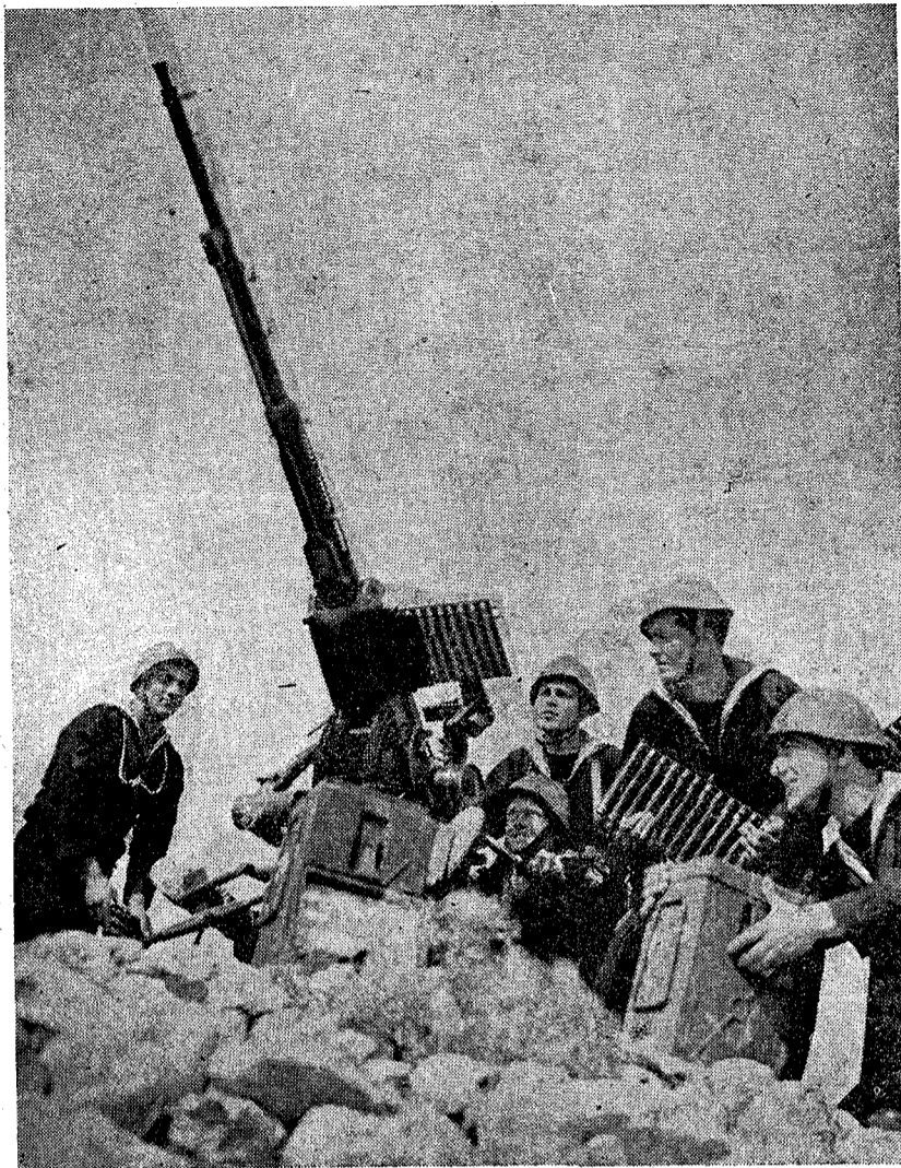
Un puesto antiaéreo de la Marina en una isla italiana del mar Egeo vigila constantemente, ante la posibilidad de un ataque enemigo