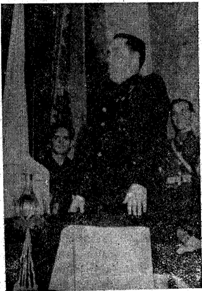
decir que el Capitán no puede ser para la Falange solamente un símbolo y un recuerdo, sino que la Falange, tiene una

misión eterna a realizar en una superación continuada.