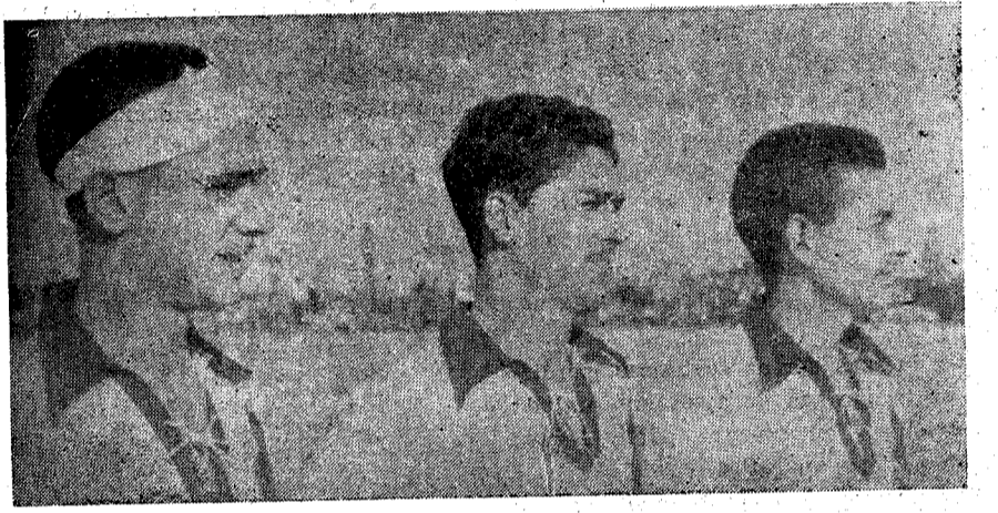
La línea media, del equipo de Artillería número 64 de Ciudad Real

Al empezar la segunda parte se lanzan los artilleros locales a fondo sobre la puerta contraria, pero los de Getafe destruyen el juego, especialmente el medio izquierda que se ha convertido en la sombra de Toledo, llegando los delanteros amarillos con facilidad a la meta contraria sin que encuentren rematador. Se señala una entrada muy fuerte de Toledo a Mejía, que el arbitro castiga. Se endurece el juego y el árbitro lo corta y si alguna vez lo hace, es perjudicando claramente a los del 64. Se cal-