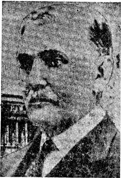
El Presidente Castillo derribado por Movimiento militar

De todos es conocida la postura que el Presidente Castillo sostenía en relación con la actual guerra mundial de estricta neutralidad, a pesar de las enormes presiones que sobre él ha ejercido durante todo el período de la guerra, la poderosa República norteamericana. El Presidente Castillo, hoy ya en el exilio, resistió a estas influencias porque conocedor perfecto de cuales eran los in-