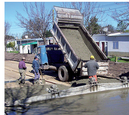
El sector está en una situación difícil.