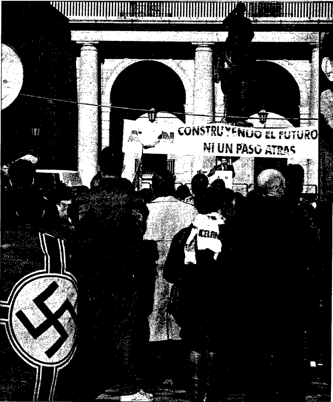
ESCASA AFLUENCIA Sólo unos pocos centenares de personas se concentraron ayer en Madrid para asistir a los actos en recuerdo de la muerte del dictador Francisco Franco.