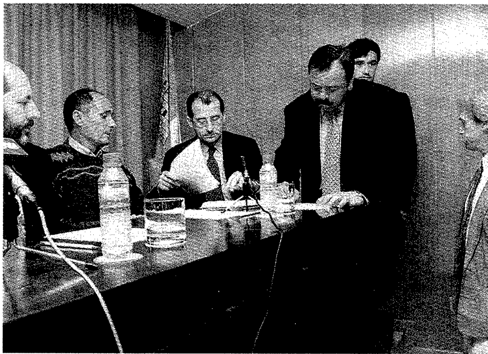
La Cámara de Comercio fue el marco elegido para la constitución de la nueva figura jurídica.

Pág. 18 Los alcarreños se trajeron del Campeonato de España cadete tres oros, una plata y un bronce.