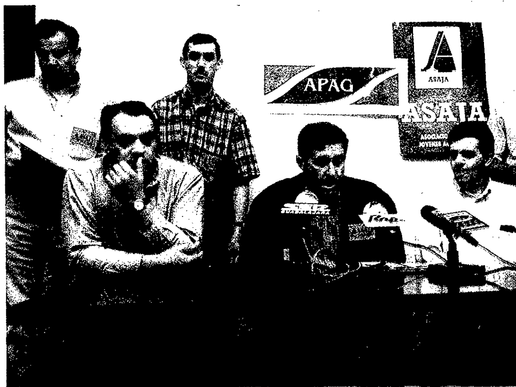
Representantes de APAG y ASAJA durante la rueda de prensa celebrada en Gelco.