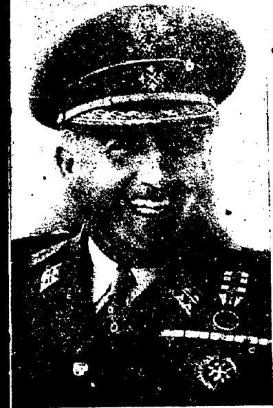
LAS DECLARACIONES DEL CAUDILLO EN LA PRENSA ARGENTINA

En una España renacida gracias a nuestro Movimiento no es posible soslayar los problemas nacionales Franco habla de Gibraltar y pide "juego limpio" entre los pueblos