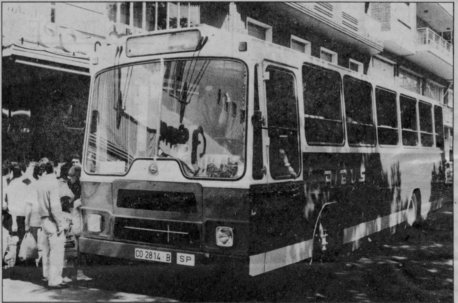
INAUGURADA LA NUEVA LINEA DE AUTOBUSES. Pág. 5

Así fueron nuestras Fiestas. Págs. 8 y 9