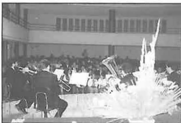
Momento de la actuación de Madrid Brass

La Casa de Cultura de Miguelturra fue el escenario elegido para la ceremonia de entrega de la decimoctava edición del certamen Carta Puebla, premio que lleva reconociendo la labor de pintores y escritores españoles desde hace casi dos décadas.