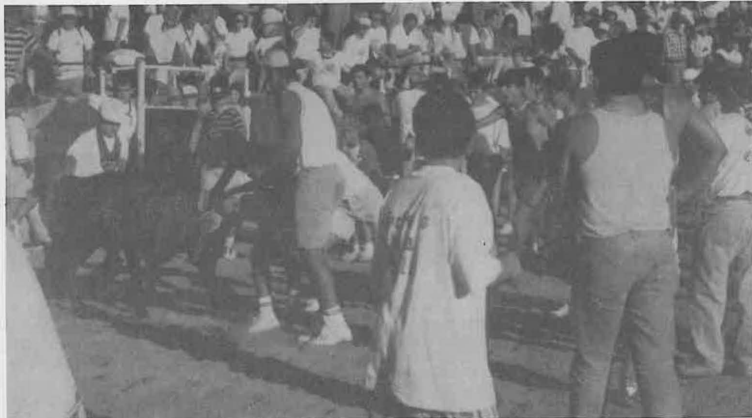
Los Festejos Taurinos, una de las actividades más populares.