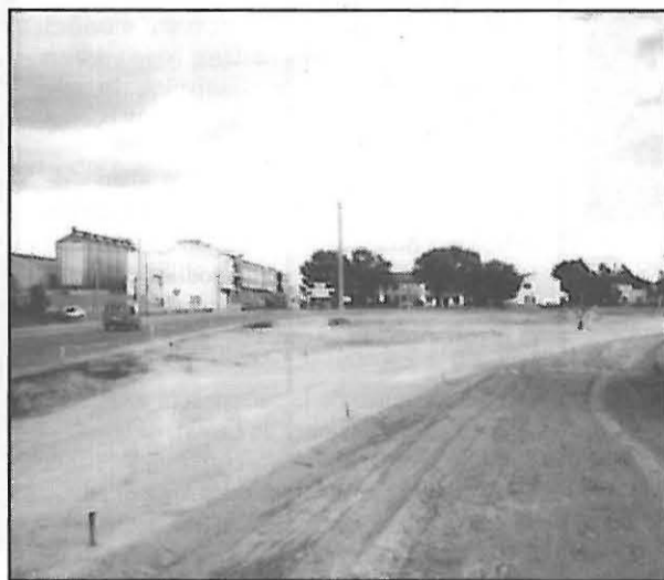
Las obras se hacen perceptibles

Tal como estaba previsto y tras la expropiación forzosa de unos 2.000 m. 2 necesarios, se comenzó la construcción de la rotonda de entrada a Miguelturra desde la carretera de Ciudad Real.