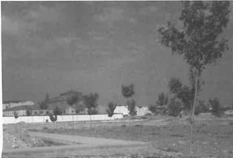
En esta zona se encuentran las parcelas

El plazo para construcción de viviendas pasa de 2 a 5 años