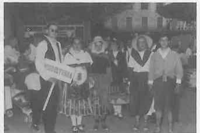
Reina, Damas y Zagales en la Pandorga 1993.

Iniciados los primeros días de septiembre, y con la llegada de feriantes con sus casetas y atracciones, todo está preparado para vivir unos días en sana alegría y convivencia. La Plaza de la Virgen será el escenario principal donde se desarrollarán numerosas y variadas actividades durante la Semana Cultural del 7 al 14 de septiembre. Asimismo, en la Pista Municipal se celebrarán bailes amenizados por conocidas orquestas, siendo gratuita la entrada. Las actividades deportivas, como cada año, ocuparán un amplio espacio durante las Fiestas, con una programación muy variada, celebrándose competiciones de todo tipo: voleibol, ciclismo, natación, fútbol, etc... Todo ello, junto con los cultos religiosos, constituirán la Programación de lo que serán las Fiestas de Septiembre 1993. (Pág. 3)