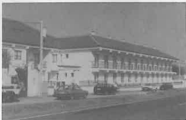
Residencia de Ancianos "Parroquia Ntra. Sra. de la Asunción".

Añadir, por último, que la gestión de la Residencia será llevada a cabo por un equipo compuesto por quince personas, de las que cinco son voluntarios y el resto personal contratado, compuesto por una cocinera, tres auxiliares de Clínica, una limpiadora, cuatro personas del servicio de comedor, limpieza y atención al anciano, y una coordinadora del equipo. Todos ellos, con ilusión y entrega, intentarán ofrecer un ambiente hogareño, donde los ancianos puedan convivir en un clima de paz y alegría.