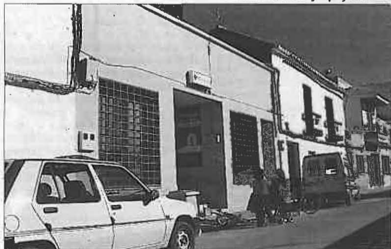
El Centro de Salud aumenta sus servicios.

Las familias con niños con edades comprendidas entre los 0 y los 7 años, recibirán en sus domicilios la etiqueta del nuevo pediatra para que sea adherida en la tarjeta sanitaria correspondiente al niño. Para aquellos niños con edades entre los 8 y los 13 años, la elección entre el pediatra y el doctor de medicina general queda a criterio de los padres; de tal manera que aquellos que opten por el pediatra deberán solicitar el cambio de médico en el propio Centro de Salud de Miguelturra. Una vez cubierto el trámite, recibirán la etiqueta de identificación para colocarla en lugar de la anterior.