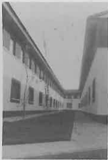
Centro Social Polivalente

La convocatoria de ayudas para este año ya ha sido publicada en el D.O.C.M. n.º 99, de fecha 30/12/92, tal como queda recogido en este boletín en la sección de convocatorias; y de la que se podrá conseguir la información necesaria en el Centro Social Polivalente.