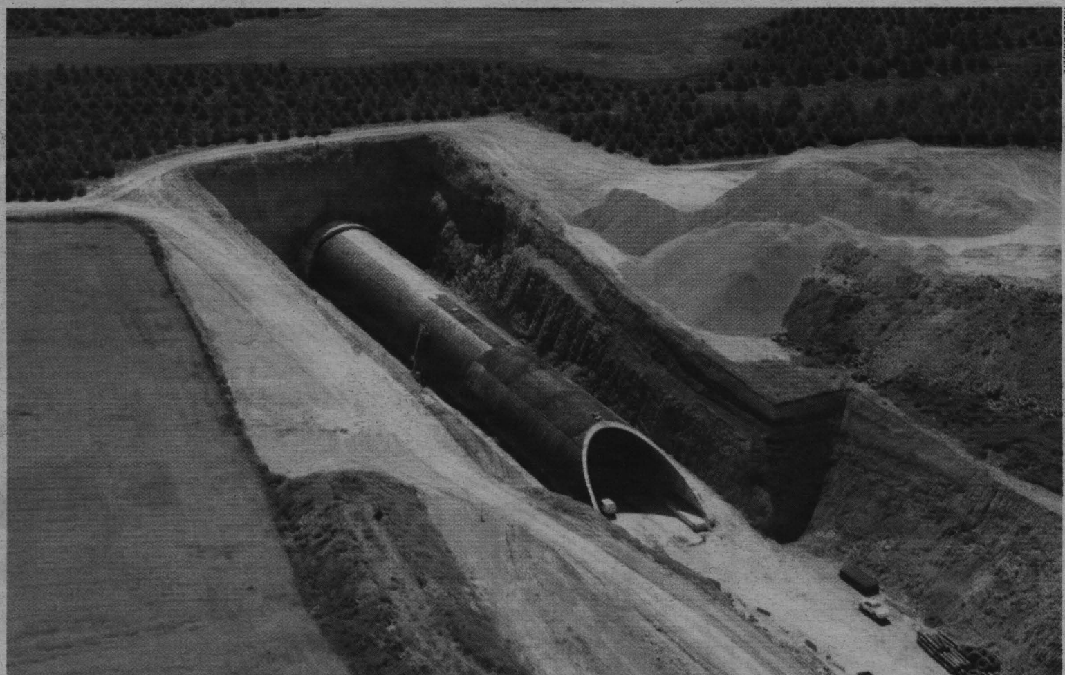
El túnel de Horcajada, de casi 4.000 metros, es el segundo más largo de la línea de alta velocidad Madrid-Levante. Está situado entre las localidades conqueses de Horcajada de la Torre y de Naharros.

Confederación Hidrográfica del Guadiana ceda de forma gratuita a la Junta 40 hectómetros cúbicos al año para que ésta pueda repartirlos entre los agricultores.