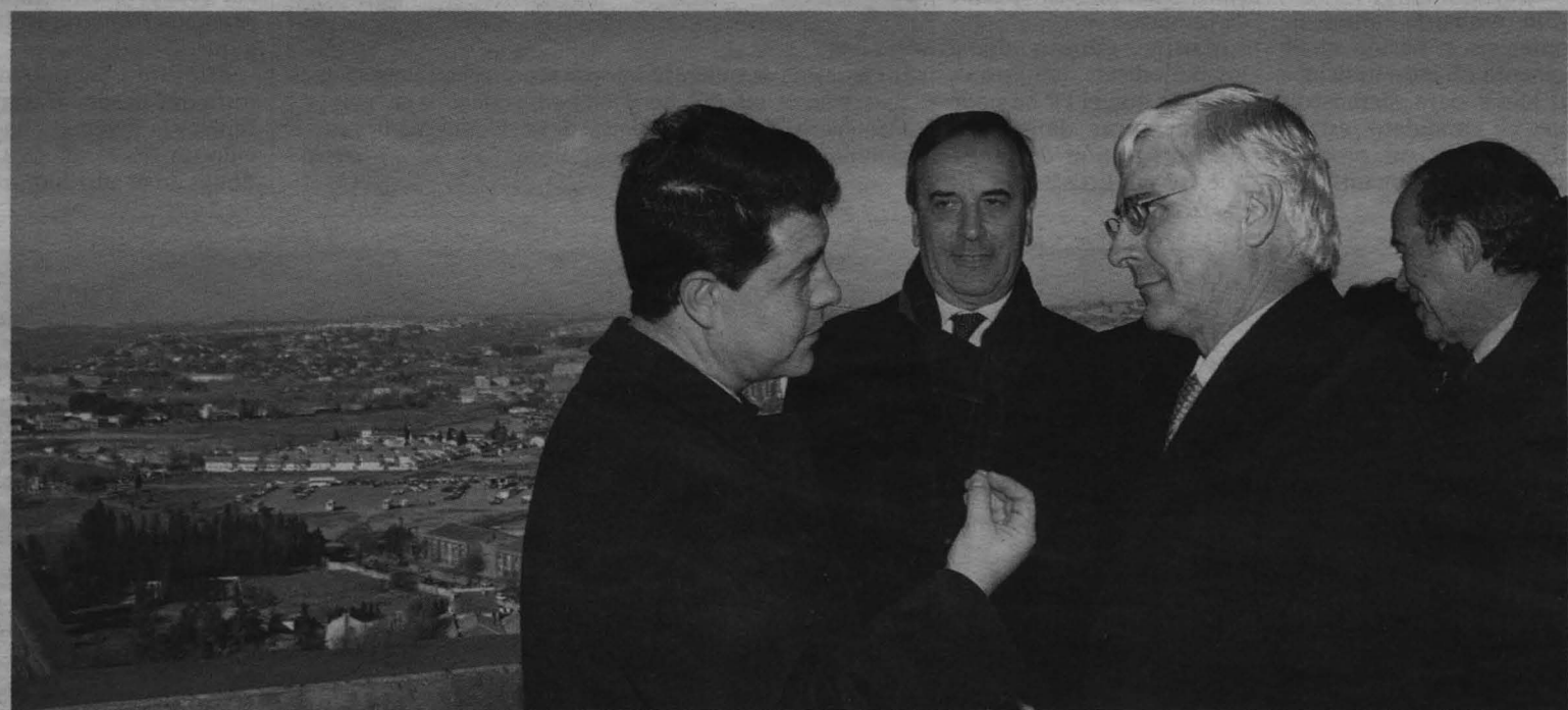
El ministro Alonso atiende a la conversación entre el presidente Barreda y el alcalde García-Page.

maria, a razón de 400 por año, y se han abierto 109 centros de salud. Un esfuerzo en la contratación que ha hecho posible que los médicos de la región tengan una media de 1.330 tarjetas sanitarias, por debajo de la media nacional, que está en las 1.500. P 02