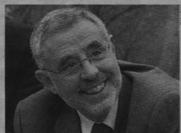
El ex alcalde de Cuenca será el defensor del Pueblo.

dos del PP, que rechazaron el nombramiento porque el candidato está inmerso en un procedimiento judicial. Se trata de una denuncia contra la instalación de una antena de televisión que ya ha sido archivada dos veces. P 02