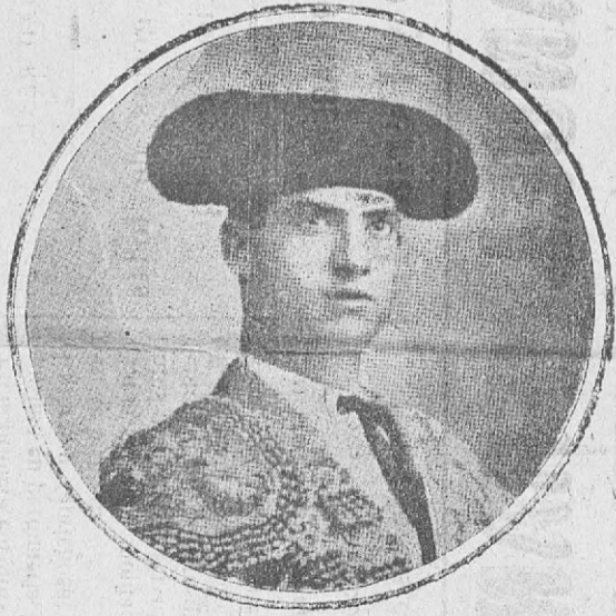
Manuel Rodríguez (Manolete)

Excelsa Patrona Nuestra Señora del Prado