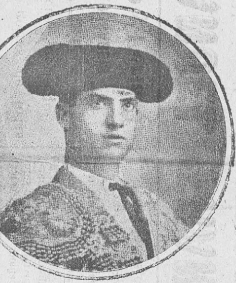
Manuel Rodríguez (Manolete)

C. Real: Tip. de «El Pueblo Manchego» - Libertad, 4.