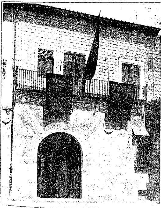
FACHADA DE LA CASA

En el arte de la arquitectura civil y muy especialmente en la doméstica, es Salamanca una de las viejas ciudades españolas de más esplendor. A pesar de lo mucho que