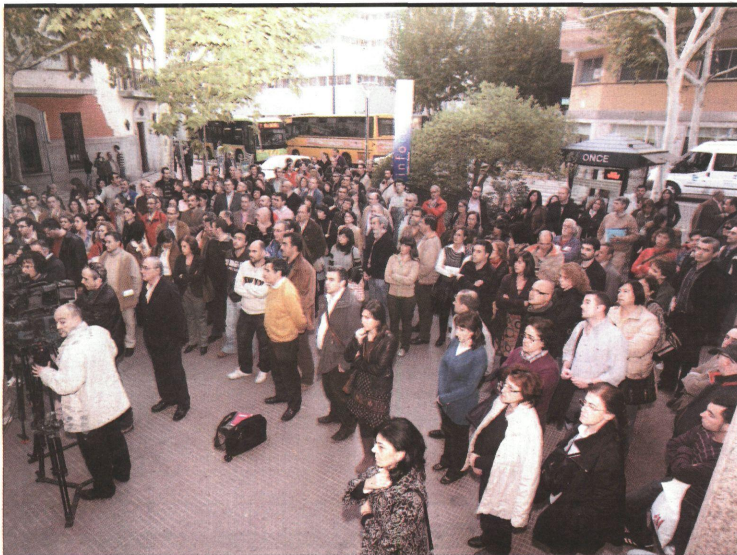
Concentración de docentes convocada por sindicatos para protestar por los problemas de convivencia en los centros educativos.

Hoy con La Tribuna, especial semanal con toda la actualidad de la temporada cinegética