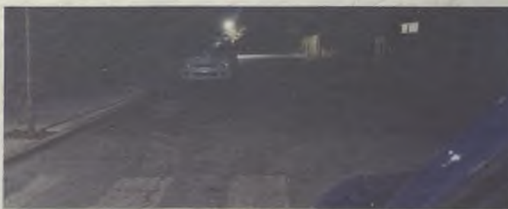
La azudense calle Fortuny y sus aledaños, el pasado fin de semana.

En total, han sido casi 80 calles, plazas, parques, áreas de juego o áreas deportivas “con deficiente o muy deficiente iluminación”, afirman los ediles. “Bellido tiene más sombras que luces”, dicen, añadiendo que esto se debe “al escaso interés que muestra el alcalde socialista por Azuqueca”. ➤ PÁGINA 6