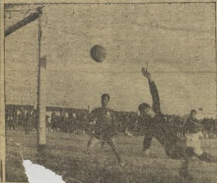
Parece que fue un trallazo de Buján, que se estrelló en la meta del portero alcazarero batido, en el partido Socuéllamos. (Información de este partido en la página trece).