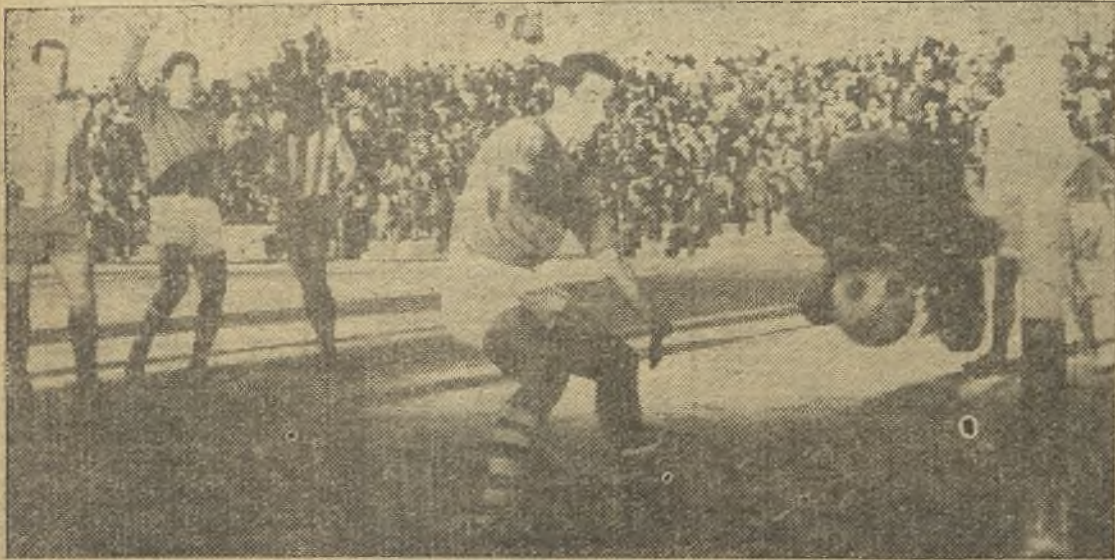
El Cacereño volvió a perder en casa, ante otro de los mal clasificados, el Don Benito, por 0-1. En la foto de Burgos, una enorme parada de Pincher, cuando ya se cantaba gol. (Información página once).