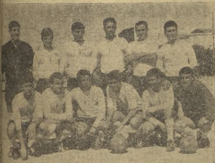
El Carabanchel, enmendando sus propios yerros, vuelve a afianzarse en el liderato del grupo XIV. Su triunfo en Villarrobledo le vuelve a dar todas las posibilidades de ser campeón y jugar la fase de ascenso. (Información en la página trece)