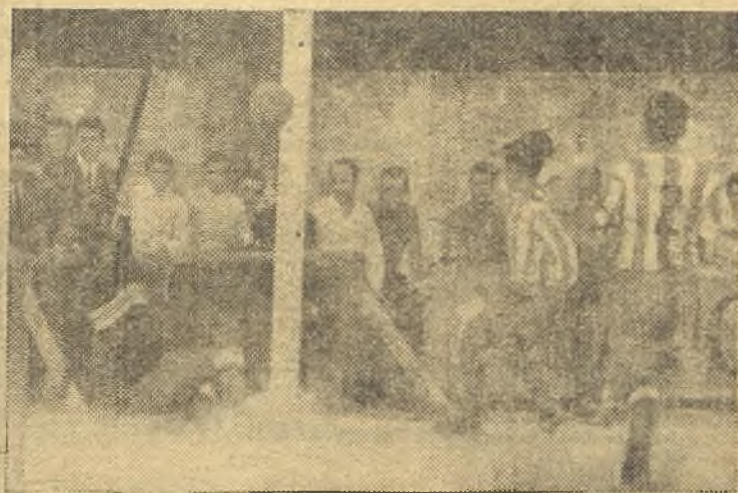
Una de los goles del Reyfra, que no pudo evitar la defensa del Atlético Calvo Sotelo, en Getafe. Buen partido con triunfo mínimo local. (Información en página trece)