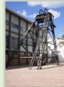
Castillete de la Mina Diógenes