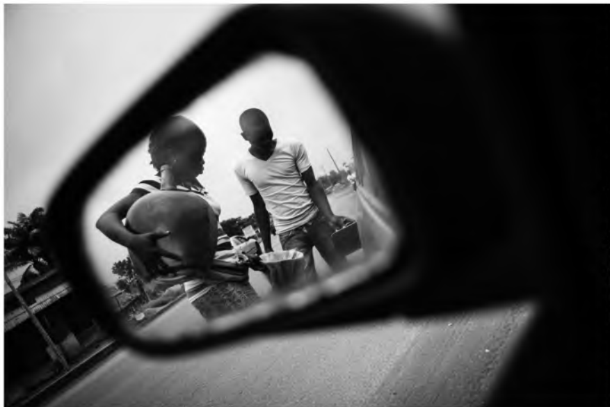
Amigos que colaboran con nosotros:

Mujeres, discapacitados, jóvenes universitarios e incluso niños dependen de esta actividad, ya que es una de las pocas alternativas de trabajo con que cuentan para tirar adelante a sus familias.