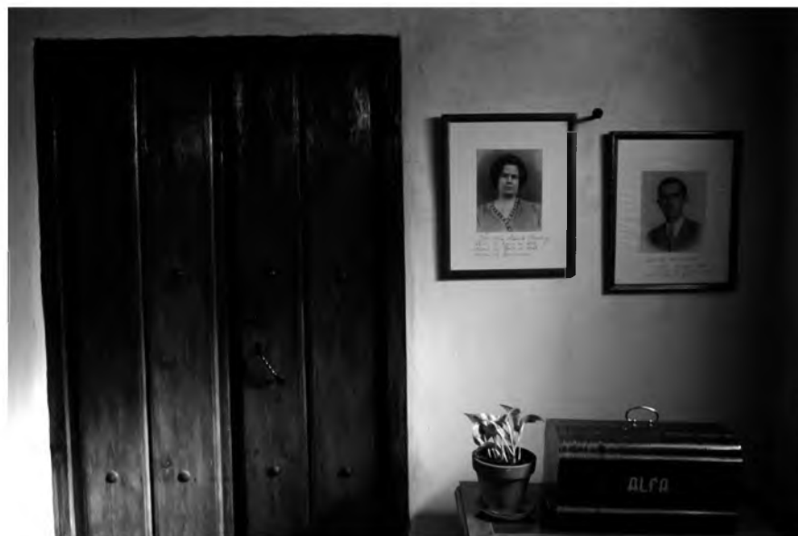
Texto: Manuel Ruiz Toribio

Las tapias de Borondo se desmoronan y a su portada blasonada la robaron malamente y quedó coja. Ningún poder ha tomado en serio estas dos joyas del XVI, salvo iniciativas caritativas que prolongan su agonía. Para estos edificios no hay ayudas ni intención de que sigan vivos. Creyentes y ateos siguen alicatando hasta el techo con dinero público, las iglesias, colegios y conventos de la mayor empresa de la exención. Iluminan a la última sus ermitas y subvencionan la celebración del dolor cada primavera. En abril hará cuatrocientos años que murió Cervantes y los dirigentes siguen dudando si el manco pasó por estas ventas o si con su mano buena nos contó lo que en ellas se cocía. Casi cuarenta años han tenido los jerarcas para que estos lugares y quien los habitan, alcancen la dignidad que se merecen. Lo mejor llegará el día de la muerte de Cervantes, volverán a enrojecernos con la lectura del Quijote, convirtiendo el gran texto en un espectáculo aburrido y grotesco a la vez. Ya les vale.