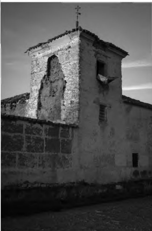
Venta de Borondo.