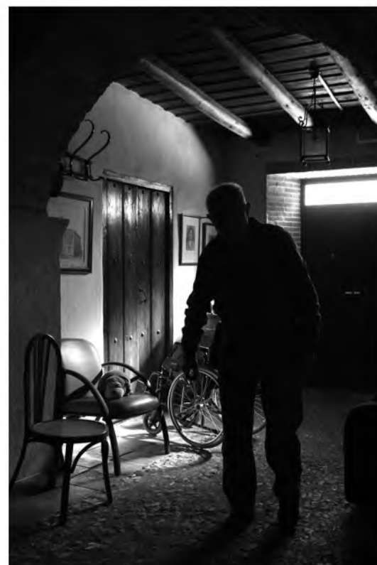
Venta de la Inés.

ALUMBRESite, calle Palma 7, Ciudad Real - www.ALUMBREFOTOGRAFIA.COM info@alumbrefotografia.com - www.facebook.com/colectivofotograficoALUMBRE