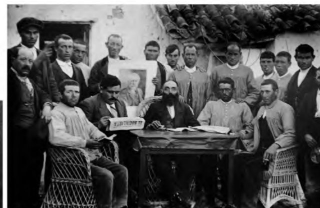
Agrupación Socialista de Villalgordo, 1925

Bibliografía: Luis Escobar, Fotógrafo de un pueblo . Publio López Mondéjar. Lunwerg editores