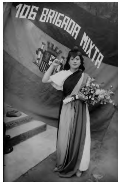
Madrina de la 106 Brigada Mixta, Albacete, 1937 - Procesión Virgen Consolación, Iniesta 1945