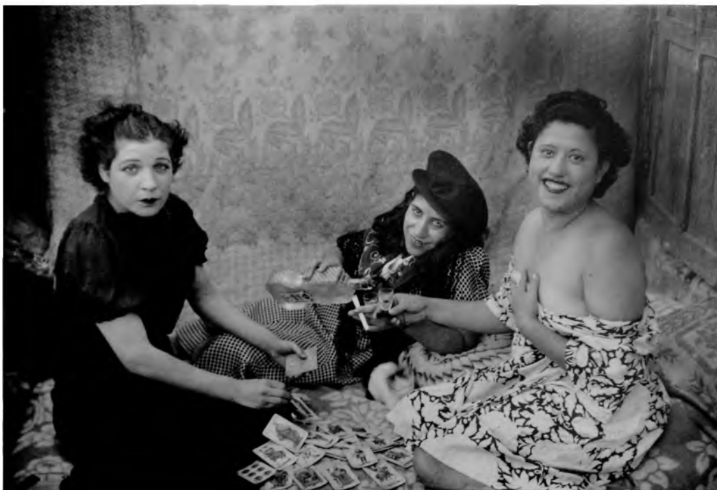
Señoritas del Alto de la Villa, Albacete, 1928