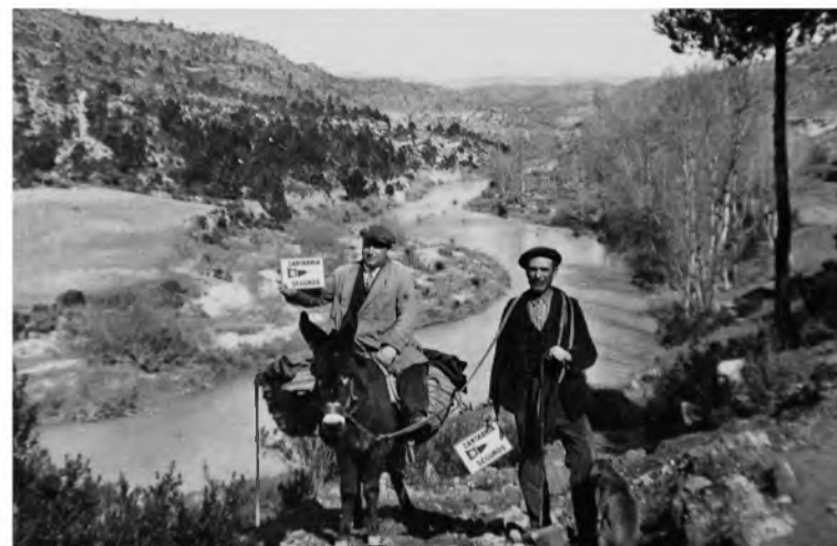
Luis Escobar viajando como fotógrafo ambulante, 1927

Luis Escobar, nacido en Villalgordo del Júcar, Albacete (1887-1963), es uno de los autores ya clásicos de la fotografía española, seguramente el más importante fotógrafo popular español de su generación. Ambulante en los años memorables de la anteguerra, su admirable capacidad para reflejar fielmente la realidad que se presentaba ante sus cámaras, sus dotes extraordinarias para el reportaje y la composición de grupos, y su cercanía con las gentes que retrató, convierten su obra en un deslumbrante testimonio gráfico de la vida íntima y pública de la España de su tiempo. Como afirma Publio López Mondéjar, descubridor de la obra de Escobar, si por algo nos conmueven hoy sus imágenes es, precisamente, por este carácter de documento, que con tanta espontaneidad y eficacia conmemora la vida preterita de los pueblos y de las gentes.