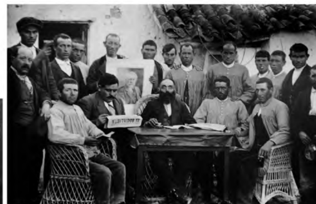
Agrupación Socialista de Villalgordo, 1925