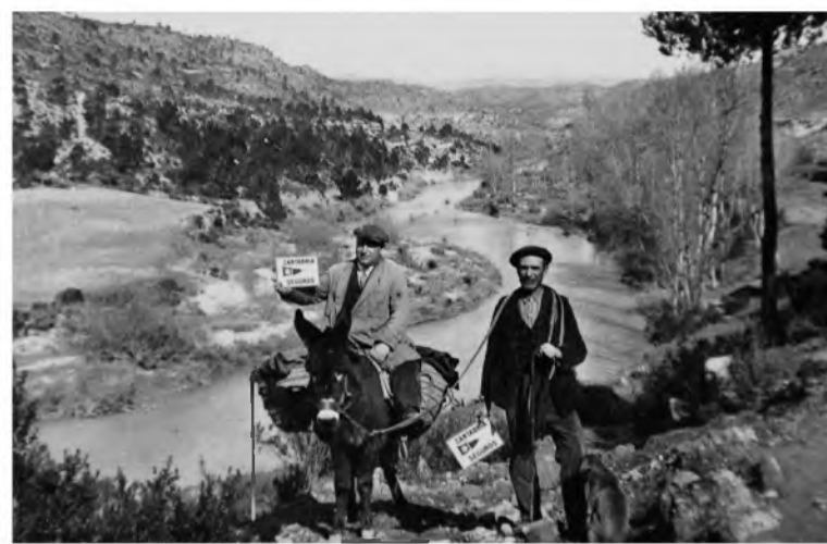
Luis Escobar viajando como fotógrafo ambulante, 1927

Luis Escobar, nacido en Villalgordo del Júcar, Albacete (1887-1963), es uno de los autores ya clásicos de la fotografía española, seguramente el más importante fotógrafo popular español de su generación. Ambulante en los años memorables de la anteguerra, su admirable capacidad para reflejar fielmente la realidad que se presentaba ante sus cámaras, sus dotes extraordinarias para el reportaje y la composición de grupos, y su cercanía con las gentes que retrató, convierten su obra en un deslumbrante testimonio gráfico de la vida íntima y pública de la España de su tiempo. Como afirma Publio López Mondéjar, descubridor de la obra de Escobar, si por algo nos conmueven hoy sus imágenes es, precisamente, por este carácter de documento, que con tanta espontaneidad y eficacia conmemora la vida preterita de los pueblos y de las gentes.