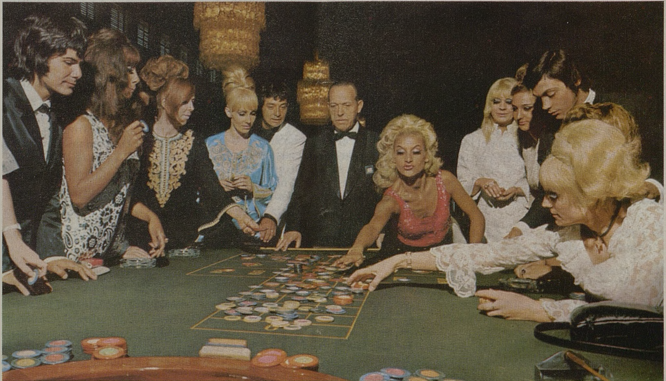
UN CASINO PARA LA REGION