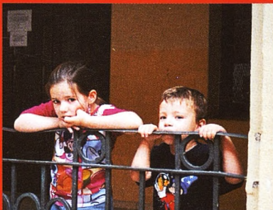
'Serena' celebra las Jornadas sobre Niños Hiperactivos