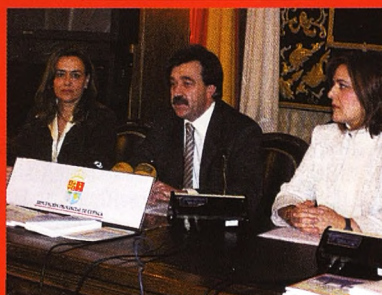
'Ediciones Provinciales', nueva colección de Diputación