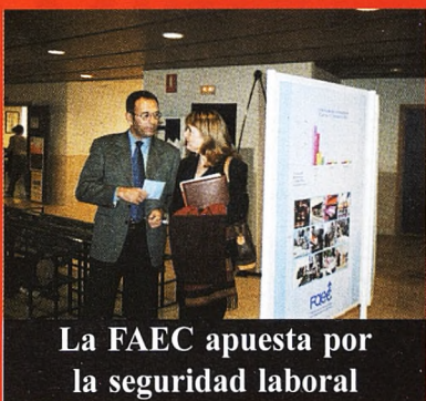
La FAEC apuesta por la seguridad laboral