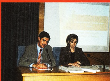
Presentados los Presupuestos Regionales