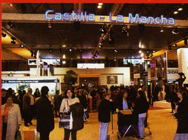
Cuenca, de gala en la gran feria del turismo