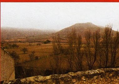
'Una lastimosa historia', relato de un crimen de Cuenca