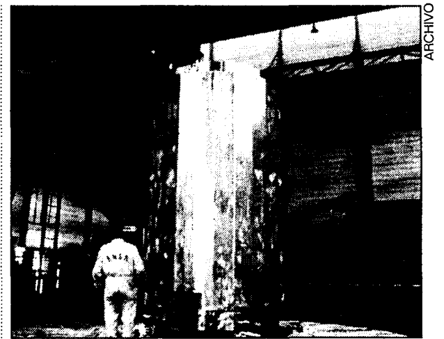
El control de fugas es una de las mayores preocupaciones.

La consultora prevé facturar este año unos 1.400 millones de pesetas, lo que supondría un incremento del 108% respecto al ejercicio anterior.